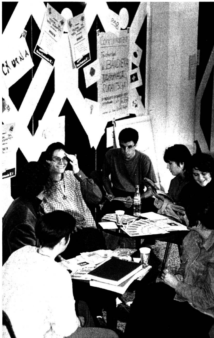
Scuntrada: stan d'infurmaziun GIURU e Punts