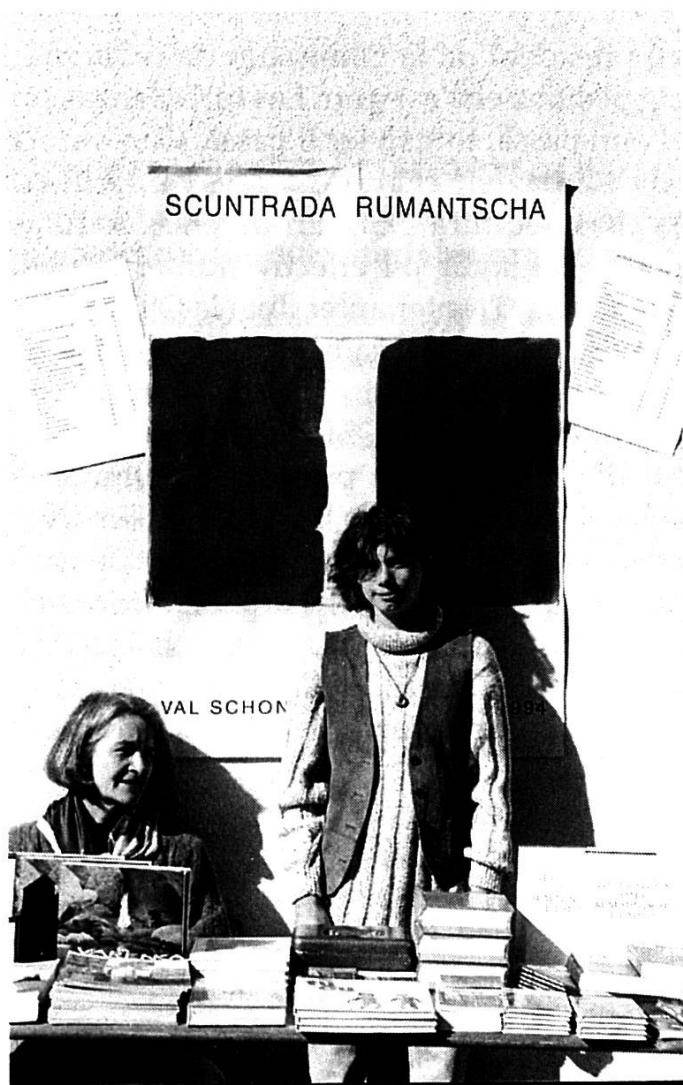
Scuntrada: stan e vendita da cudeschs

La propaganda per ils cudeschs succeda, per mancanza da finanzas per inserats, cun fecls specifics tramess a gruppas d'interessents ed agiuntads a las furniziuns da cudeschs. Systematicamain vegnan las ediziuns novas preschentadas en las medias. Per in nov catalog da las ediziuns rumantschas en vendita da diversas chasas edituras è vegnidas fatgas emprimas preparaziuns. Ina realisaziun duess esser pussaivla l'onn 1995.