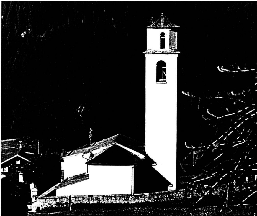
S. Catregna a Sour, cun bagn las pi remarcablas disproporzziuns da grondezza tranter baselgia e clutger!

per bagn e cumadevладad da chest pievel. Er lò on els scu para biagia ena tgesetta per pudeir sa restabileir.