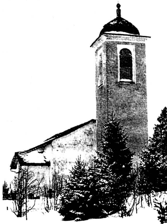
Las dus baselgias da Beiva, «corpus delicti» per las noschas dispettas. Sanester: La baselgia reformada dasper la veia da traffic, erigeida tranter 1660 e 1670. Dretg: La catolica, numnada per l'amprem'eda 1219, ma tgunsch anc pi viglia. Patrocini è s Gallus.

Ossa sa dumandaro bagn mintgign, scu tg'igls paders èn nias tar ena tgesa per abitar aglmanc an moda deschainta e per metter no la baselgia degna per en sarvetsch divin, scu er per instrueir igl pievel ainten las verdads dalla cardientscha catolica.