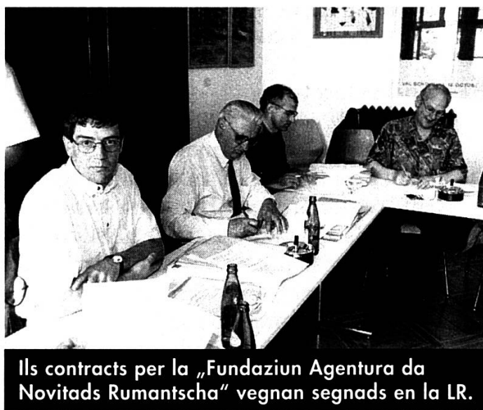
Il contracts per la „Fundaziun Agentura da Novitads Rumantscha“ vegnan segnads en la LR.