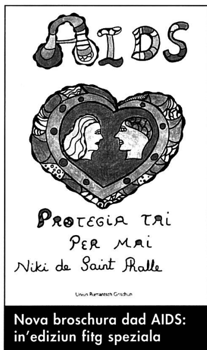
Nova brochura dad AIDS: in’ediziun fitg speziala

Dapi ch’il nov artigel da linguas è vegnì acceptà s’augmentan las dumondas surtut per translaziuns curtas, sco per exempel nums da firmas ed instituziuns, auguris, slogans, inscripziuns, e.a. Nossa clientella stabla (PTT, viafiers, banca, cassa da malsauns, instituziuns socialas e culturalas etc.) ans è stada fidaivla era durant quest onn da recessiun. Nus avain exequì 221 translaziuns en rumantsch grischun e 91 en ils idioms. Questas cifras na cumpiglian betg las numerusas translaziuns pitschnas numnadas sura e las infurmaziuns al telefon. Plinavant avain nus danovamain procurà il 1996 per ils suttitels tudestgs da l’emissiun da televisiun Telesguard . Vers la fin da l’onn essan nus era stadas occupadas cun translaziuns d’artigels e d’inserats per la nova gasetta rumantscha La Quotidiana . Lura avain nus fatg differentas translaziuns pli voluminusas, tranter auter: