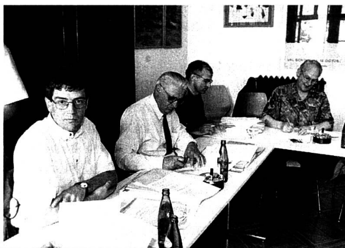
Il contracts per la „Fundaziun Agentura da Novitads Rumantscha“ vegnan segnads en la LR.