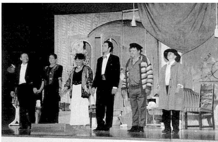
Scena or dal teater «Il cant dil salep» dad Alfonso Paso representà da l'Uniun da teater Domat/Ems durant la Scuntrada

La LR ha retschet 37 teaters – 6 originals e 31 translaziuns – per integrar en la biblioteca da teater. Quella cumpiglia totalmain 1443 teaters rumantschs. Durant l'onn da rapport è vegnida endatada l'entira biblioteca da tocs en ina banca da datas sin computer tenor differents chavazzins. Ella vegn cumplettada ed amplifitgada permanentain.