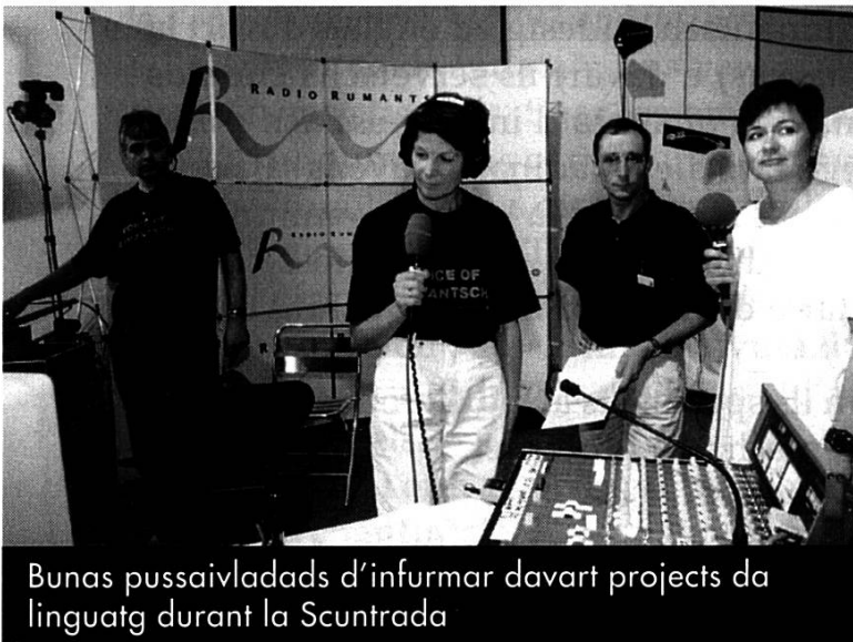
Bunas pussaivladads d'infurmar davart projects da linguatg durant la Scuntrada