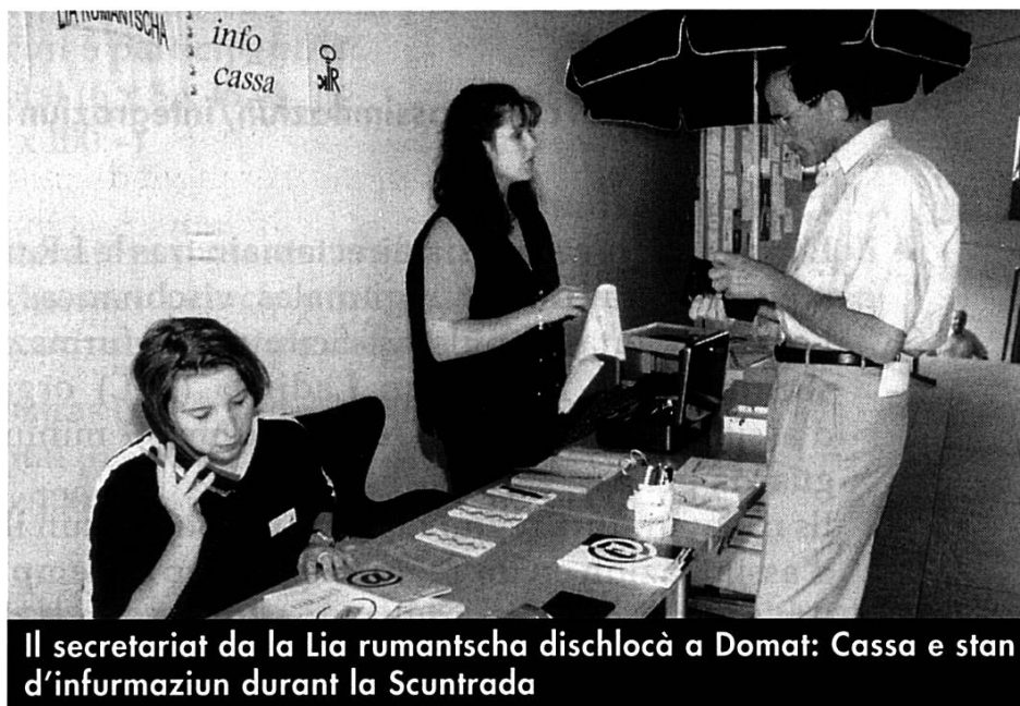
Il secretariat da la Lia rumantscha dischlocà a Domat: Cassa e stan d'infurmaziun durant la Scuntrada

La biblioteca da la LR vegn amplifitgada regularmain cun las novas ediziuns che cumparan en rumantsch tar las diversas chasas edituras, na vegn dentant betg tgirada professiunalmain. In project da sanar la biblioteca cun forzas da lavur d'in program d'occupaziun cun sustegn da la cassa da dischoccupaziun n'ha betg pudì vegnir realisà durant l'onn da rapport.