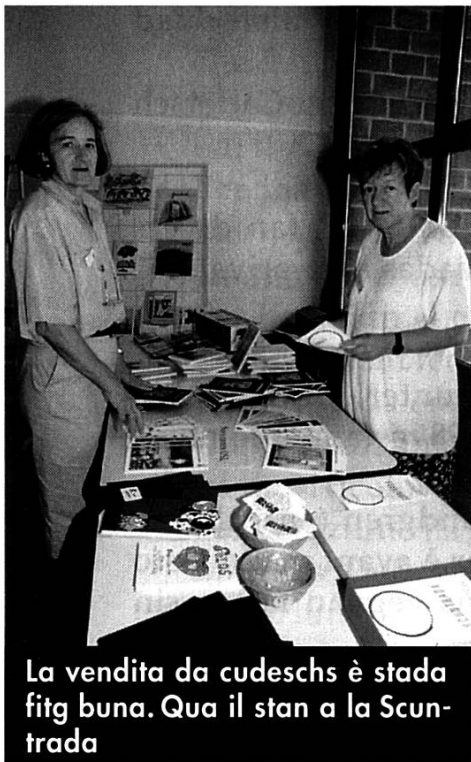
La vendita da cudeschs è stada fitg buna. Qua il stan a la Scuntrada

persunas ed er a librarías en ed ordaifer il territori. Quest servetsch vegn stimà e gida considerablain a derasar las ediziuns rumantschas.