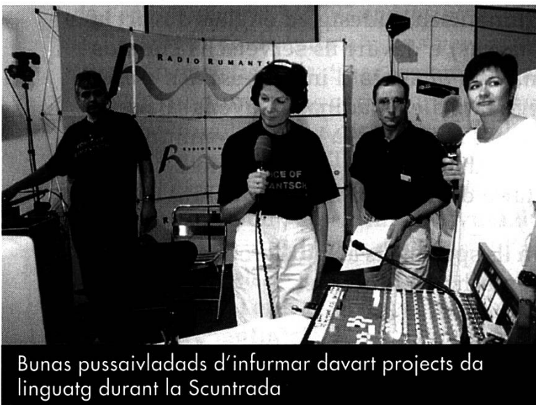
Bunas pussaivladads d'infurmar davart projects da linguatg durant la Scuntrada