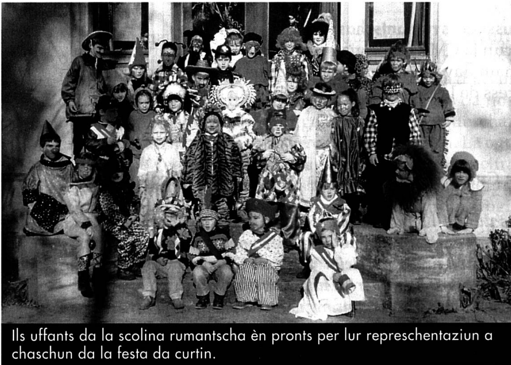
Il s uffants da la scolina rumantscha èn pronts per lur represchentaziun a chaschun da la festa da curtin.

La Fundaziun Chasa rumantscha ha decidì in credit per mobigliar nov per las scolinas.