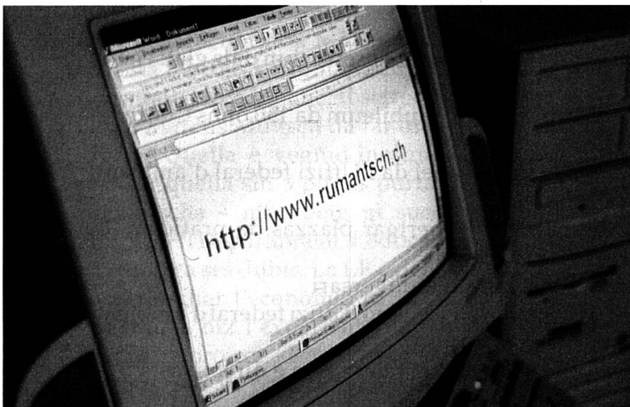
Las preparaziuns per la preschientscha da la LR sin l'internet èn progredidas