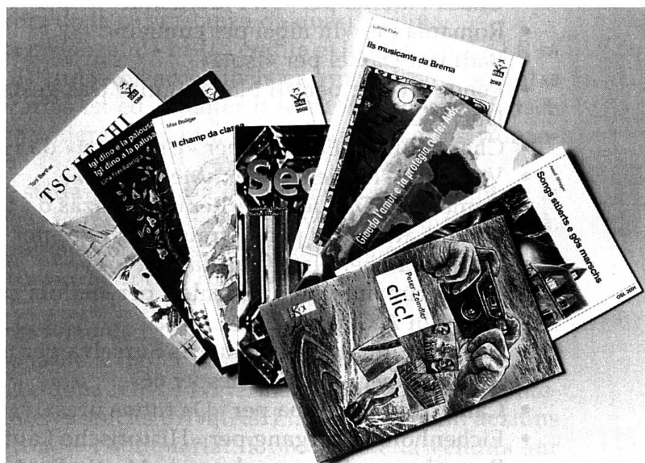
Il sortiment da carnets OSL è vegnì amplifitgà cun 8 novs titels