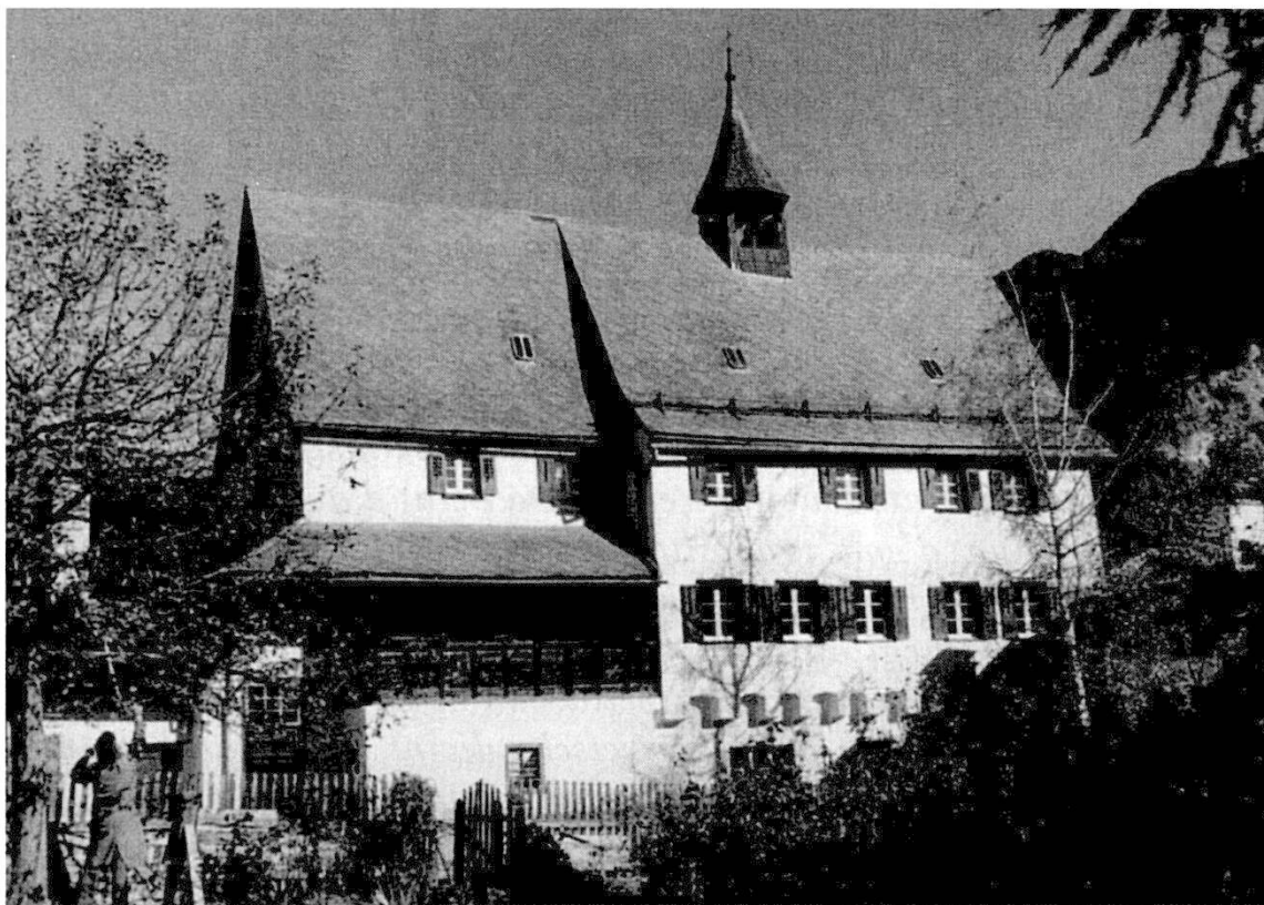
La tgesa pravenda, igl ospizi digls paders caputschins