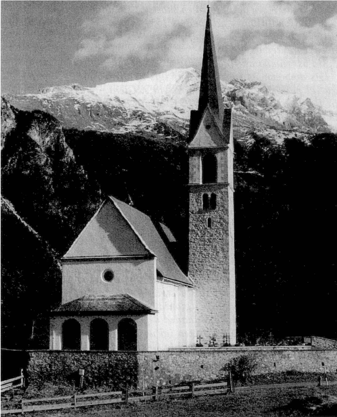
L'imposanta baselgia da s. Giera segl crest sur Salouf

chezza: «Igl segn dalla sontga crousch». Stuond igl uestg constatar la miserabla tgeira religiosa da chest pievel antras l'insufficienza da chest pover prer, ò monsignour fatg l'istanza agl prefect per far tar-metter ( a Salouf ) dus caputschins.