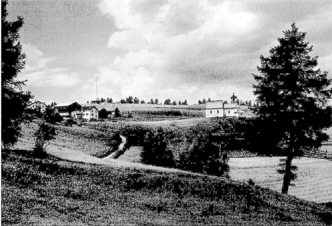
La fracziun Del sur Salouf cun la baselgna construeida an 2 etappas, deditgeida a s. Roc, igl patrung cunter la pesta.

Er schi la parochiala a Salouf vign numnada per l'amprem'eda pir anturn igls 1290 34 dastg'ins supponer cun buna raschung, tgi sot chella dad oz ins cattess per franc igls mussamaints per aglmanc egn bietg bler pi vigl. Chegl giond or d'ena confruntaziun cun otras «baselgias viglias», gist angal tar pleivs manevlas, p. ex. Stierva e Mon (s. Cosmas), noua tgi ellas èn gio documentadas per igls onns 800. Ed alloura zont risguardond d'ena vart igl fatg, tgi Salouf sa cattava gio dall'èra romana ed anc pi tard dasper la veia da transit impurtanta, era da l'otra vart ena tscherta centrala antras lezza curt, – igl ampren sedia d'en administratour imperial, sessour digls func-