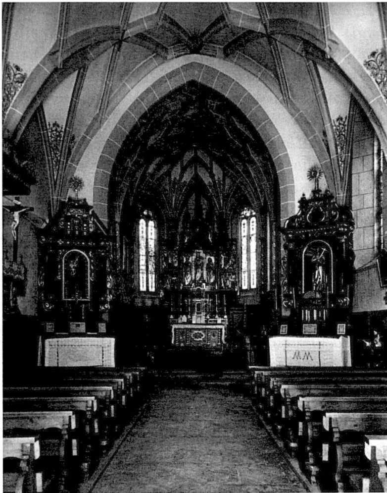
S. M. Madlagna a Stierva anfignen 1980 cun igls dus altars barocs e la canzla, tot da ca. 1660. Ve digl arviout anc las pitturas dalla renovaziun 1922. Segl altar da vart dretga: s. Maria Madlagna, la patrunga dalla baselgia.