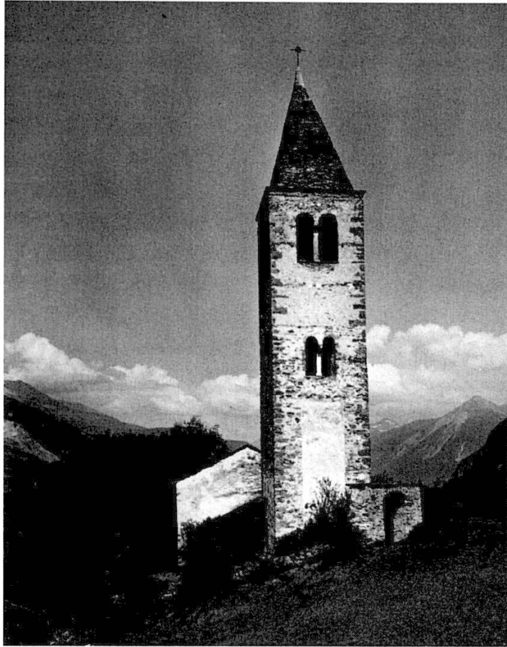
S. Cosmas e Damian segl Crest sot Mon. Sen la fatscheda digl clutger bagn vasibel anc igl cader digl anteriour maletg da s. Cristoffel, tgi – scu a Lantsch – vurdava vers la vischnanca. Dasper la baselgia era igl santieri.

Factum ègl, tgi ainten igl frataimp anfignen 1623 ins sainta navot dad en plevant stabel a Mon. Per cletg ò lez onn igl uestg reintroduia igl act d'obadientscha sto decreto gio digl concil da Trient (1545–1563) ed avant adegna prattitgia, numnadamaintg igl cumond da Roma agls uestgs, tgi els stoptgan visitar regularmaintg tot las pleivs. En usit tgi era nia sistia digltottafatg causa digls viriveris politics tigls ambrogls grischuns siva digls 1600.