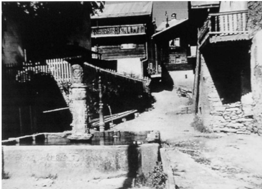
La fontauna gronda da 1847 el center dil vitg da Cumbel. La petga era encoronada cun las armas dallas famiglias las pli veglias burghaisas da Cumbel. Bein visibla ei la gelgia en l'arma dils Arpagaus.

Il feagl Johann ni Gion ei staus ina dallas pli impurtontas persunalitads dils Arpagaus da Cumbel. El ha surviu sco magistrat en Lumnezia ed en la Ligia Grischa. El ei naschius ils 1 da december 1683 e carschius si a Sursaissa dal temps, nua che siu bab Murezi er'aunc activs ella politica dallas Ligias. Gion haveva 30 onns, cura che siu bab ei morts. Igl ei buca documentau, tgei ch'el ha luvrau entochen lu. Igl ei da supponer che Gion havevi fatg empau scola e ch'el seigi staus en survetschs jasters per exempel ella Italia a Cre-