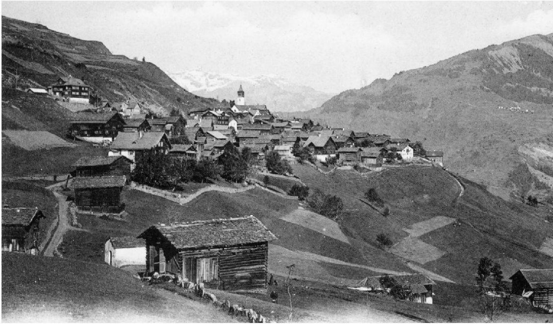
Cumbel entuorn 1900

60 renschs 13 . Suenter il capitulat dils 2 da settember 1639 che ha menau las Ligias en la dependenza da Milaun ei la gronda part dils amitgs dalla Frontscha ella Ligia Grischa ed en Surselva sesuttamessa all'influenza spagnola. Aschia era ils Arpagaus da Cumbel.