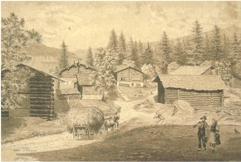
Ill. 1: «Waldhäuser bei Flims», 1874. Tusch da sepia da H. Heidegger. Entamez il maletg l’odierna Via Sorts sut.

dal 19avel tschientaner rumantsch. Da confessiun sajan ils da Flem, uschia von Salis-Seewis, reformads. Ils da Flem na sappian dentant betg sa glori-fitgar dad esser attents ed undraivels durant il servetsch divin. Era il catechissem na vegnia betg visità diligentamain, abstrahà dal fatg che la scola vegnia savens negligida. Quella saja finanziada entras fondos, cuzzia quatter mais e sa cumponia da duas classas, da las qualas la superiura vegnia manada dal reverenda. Ins na possia dentant betg pretender che Flem fatschia cun il status da scola plitost pover – uschia ha l’autur relativà sias indicaziuns – in’exceptiun en il chantun Grischun. En tutta cas na vegn la scolaziun da Sixtus Seeli betg ad esser stada autra che quella da blers uffants en la fasa avant l’introducziun dad ina scola obligatoria 13 ; in lung temp da l’onn gidavan els ils geniturs en il manaschi a chasa ni ch’els fachevan servetsch champester tar terzas persunas. La mancanza dad ina scolaziun pli vasta en las gruppas socialas, da las qualas ils blers langeghers provegnivan, sa mussava pli tard diversas giadas en lur scrittira. Pli navant è la correlaziun tranter status social e lavur era vesavla en la decisiun da vulair lavurar en il corp da polizia: per persunas pli bainstantas – a Flem per exempel tenor tradiziun la famiglia dals Capols – na fiss quest servetsch betg stà dign avunda. 14