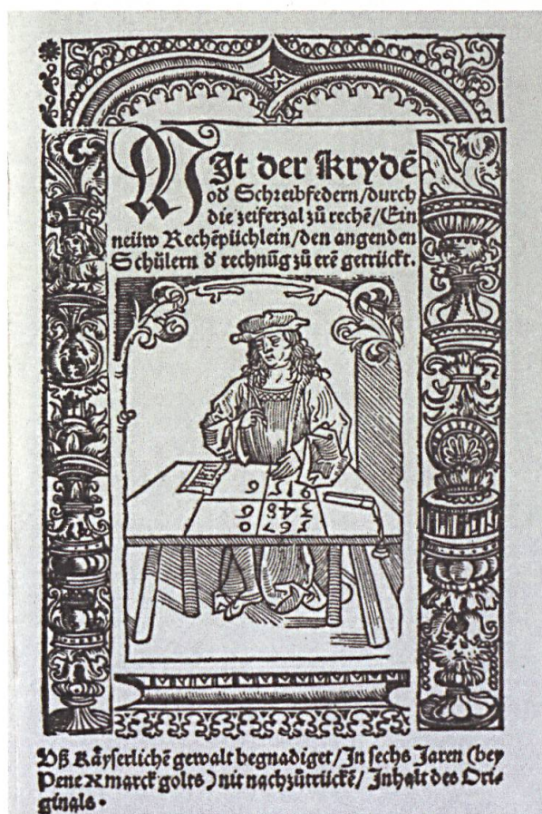
Il frontispizi da Köbel (1520).

dals suffixs latins -AMENTU, -ANCA, -ANCU, -ANTE, -ANTĪA, -ENTE ed -ENTU per il punct E 51 en Reg. DRG. 2012, 97–101) 9 . Questa curta analisa mussa che l'autur dad Vn auisamaint agli lettur viveva en il sedeschavel tschientaner e derivava da Samedan. Perquai na datti nagin motiv da metter en dumonda las indicaziuns en il text, tenor las qualas Gian Giachem Bifrun ha scrit il text l'onn 1558.