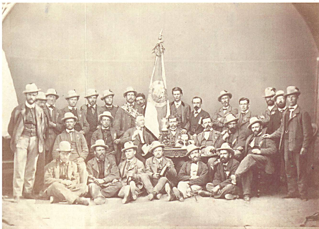
Chor viril Ligia Grischa, 1870.