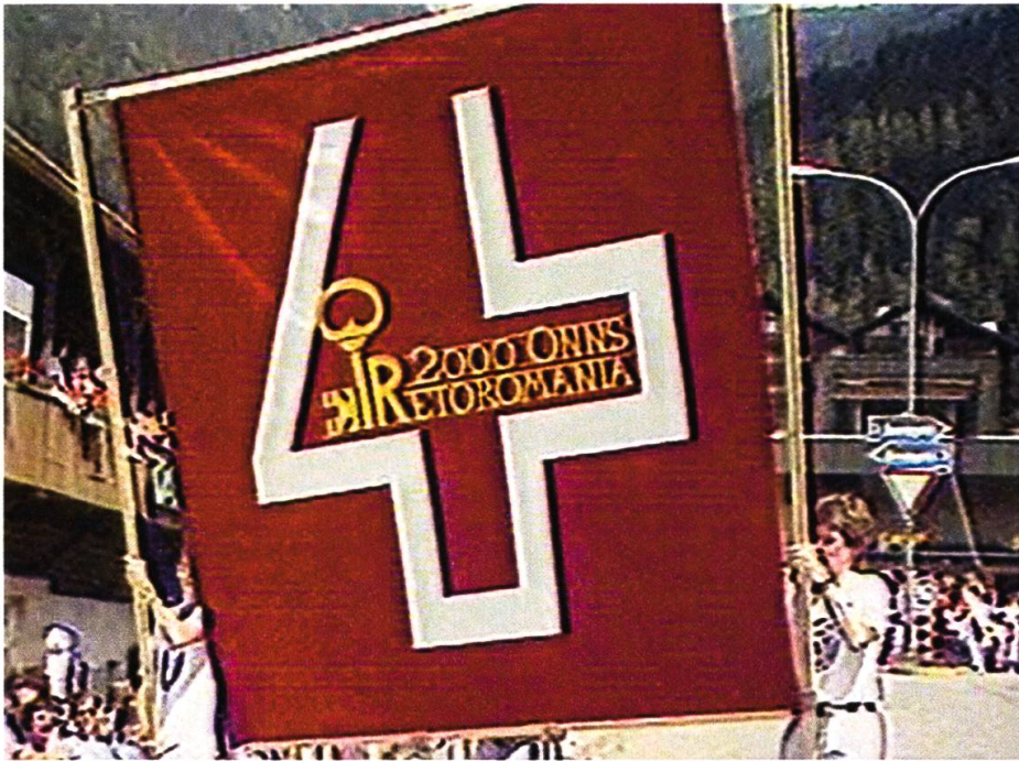
Bandiera «2000 onns Retoromania» durant il til a Savognin (1985), ord la Svizra Rumantscha dals 08-09-1985.

radunanzas; referats; sairada da gala; servetsch divin ecumentic u er in til. 39