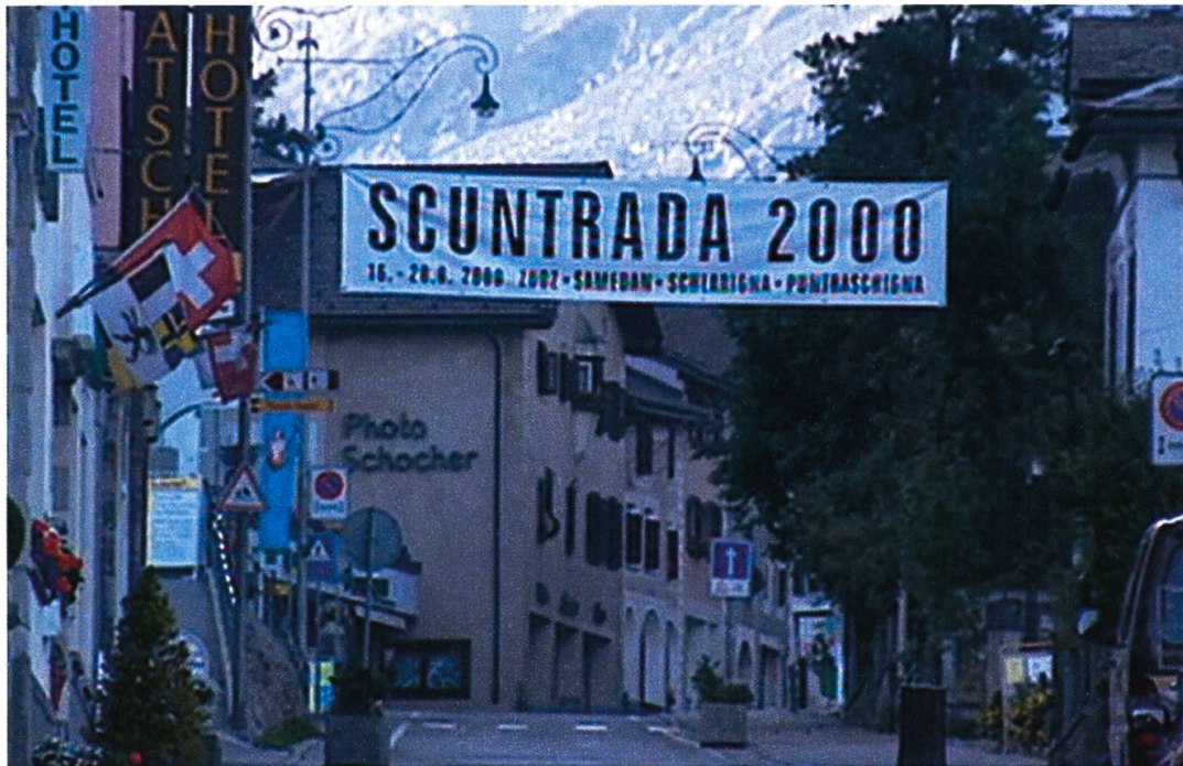
Bandiera da la Scuntrada 2000 a Puntarascogna, or dals Cuntrasts dals 27-08-2000.