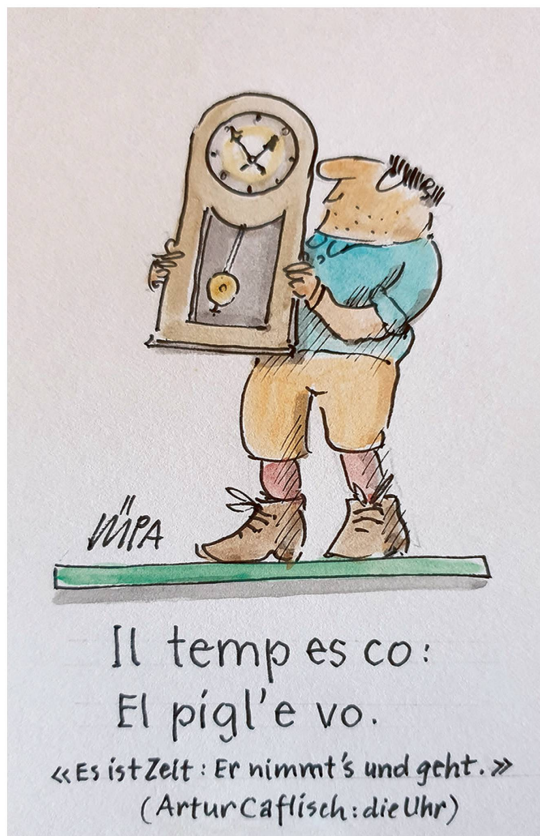
Il temp es co: El pigl'e vo. «Es ist Zeit: Er nimmt's und geht.» (Artur Capfisch: die Uhr)