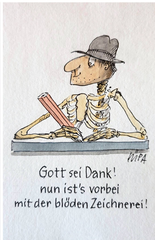
Gott sei Dank! nun ist's vorbei mit der blöden Zeichnerei!