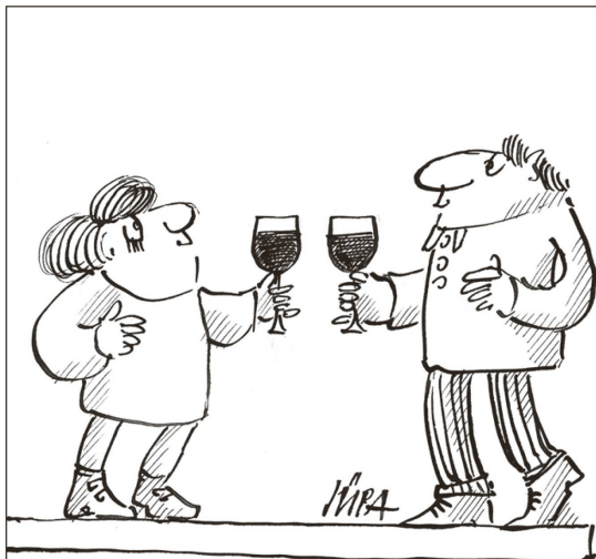
la situaziun «vin-vin»