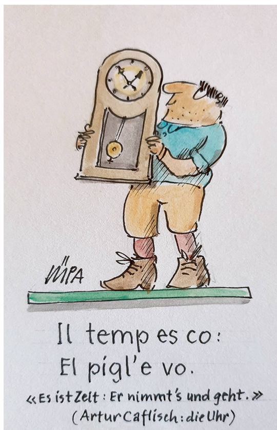
Il temp es co: El pigl'e vo. «Es ist Zeit: Er nimmt's und geht.» (Artur Capfisch: die Uhr)