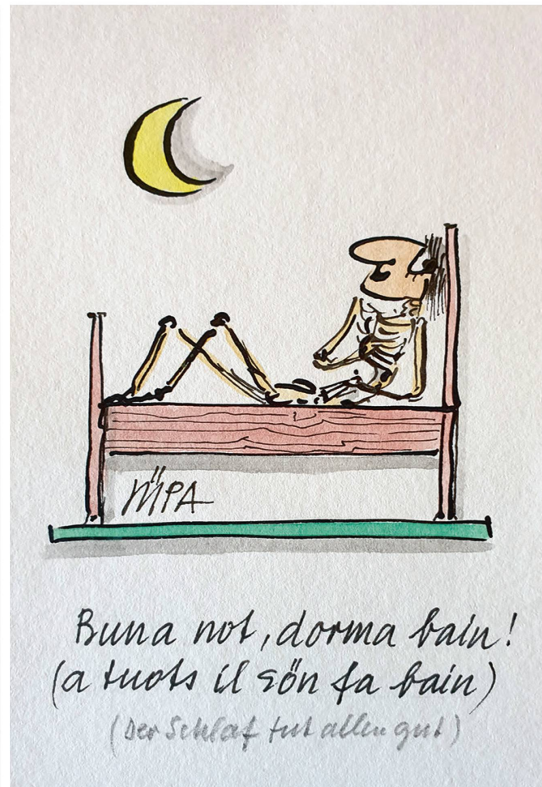
Buna not, dorma bain! (a tuots il s'òn fa bain) (Der Schlaf tut allin gut)