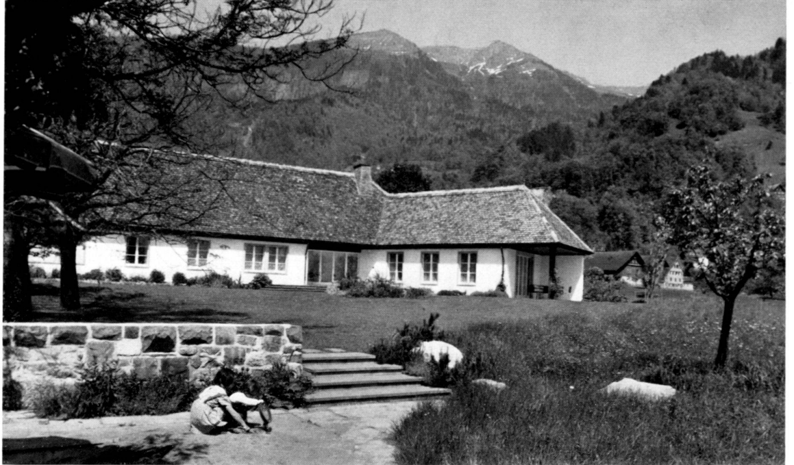
3 Blick vom Sandspielplatz gegen das Landhaus Vue de la place de jeux pour les enfants vers la maison View from the playground on to the house