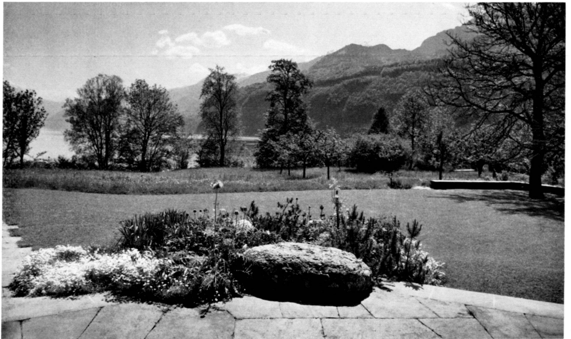
4 Ausblick vom Wohnzimmer La vue prise du living-room View from the living-room