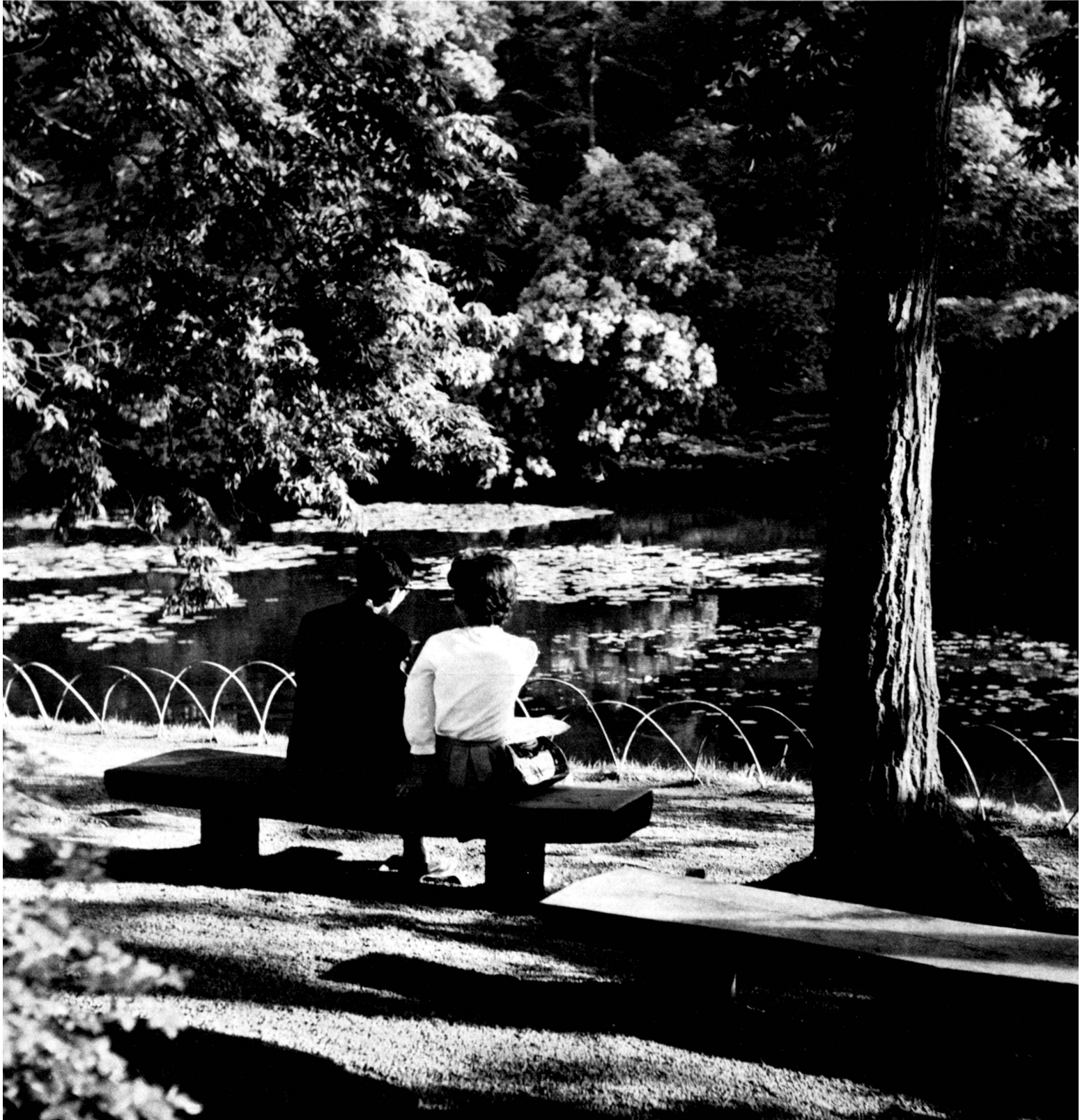
Rikugien Park, Tokyo