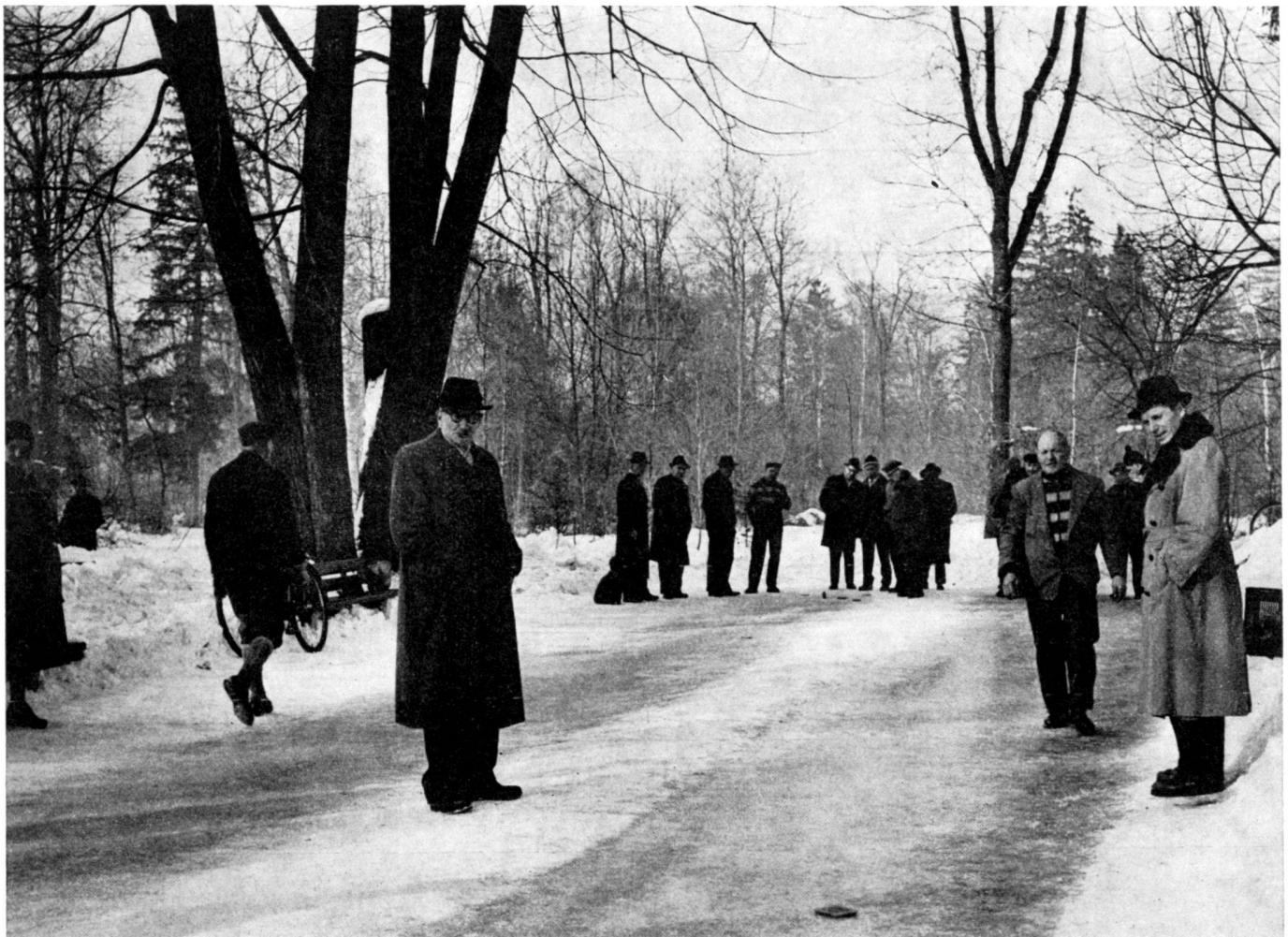
8+9 "Plattl"-grounds in summer and in winter 10 An existing brook was enlarged and dammed up to form a delightful pond for splashing and small rafts