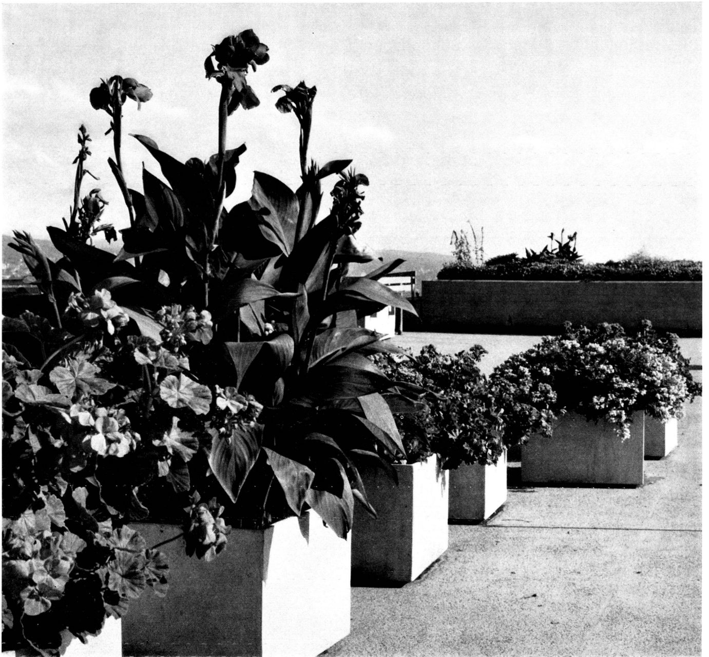
ETERNITPFLANZENBEHÄLTER AUF EINER DACHTERRASSE