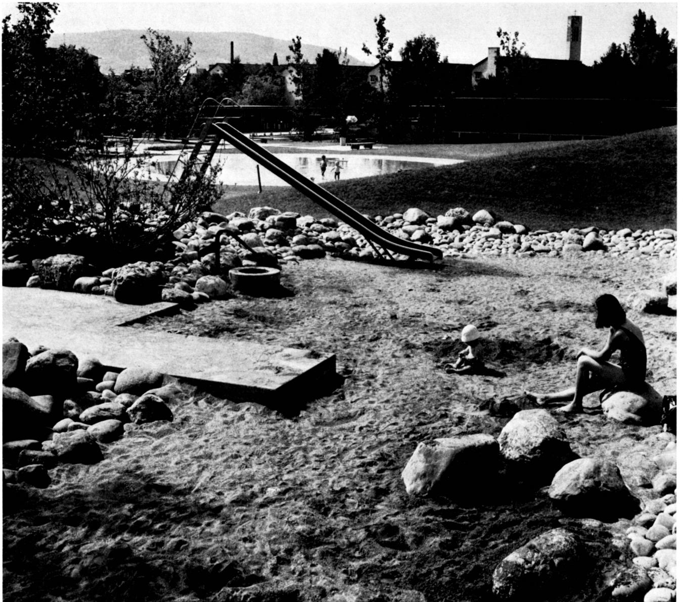
Links: Das kreisrunde Planschbecken von Osten. Unten: Ecke Mutter und Kind mit Planschbecken von Nordwesten.