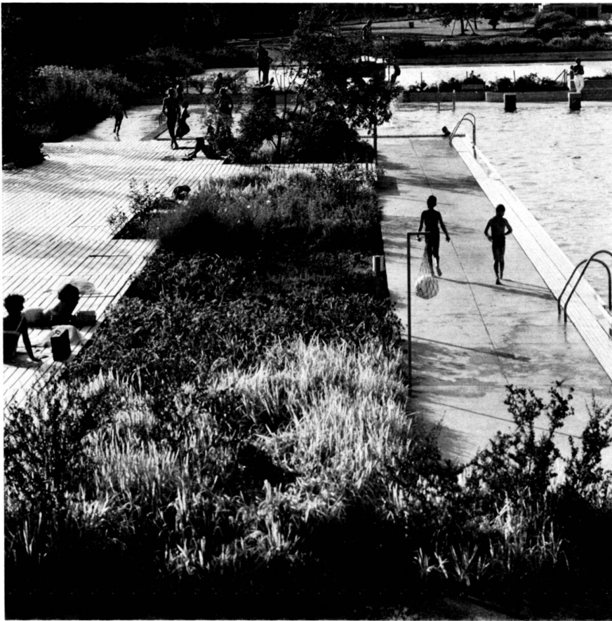
Verkehrsordnende Rabatte flächig bepflanzt. Plate-bande à fonction de régulateur de circulation (plantation compacte). Traffic-guiding border with low-growing plants.