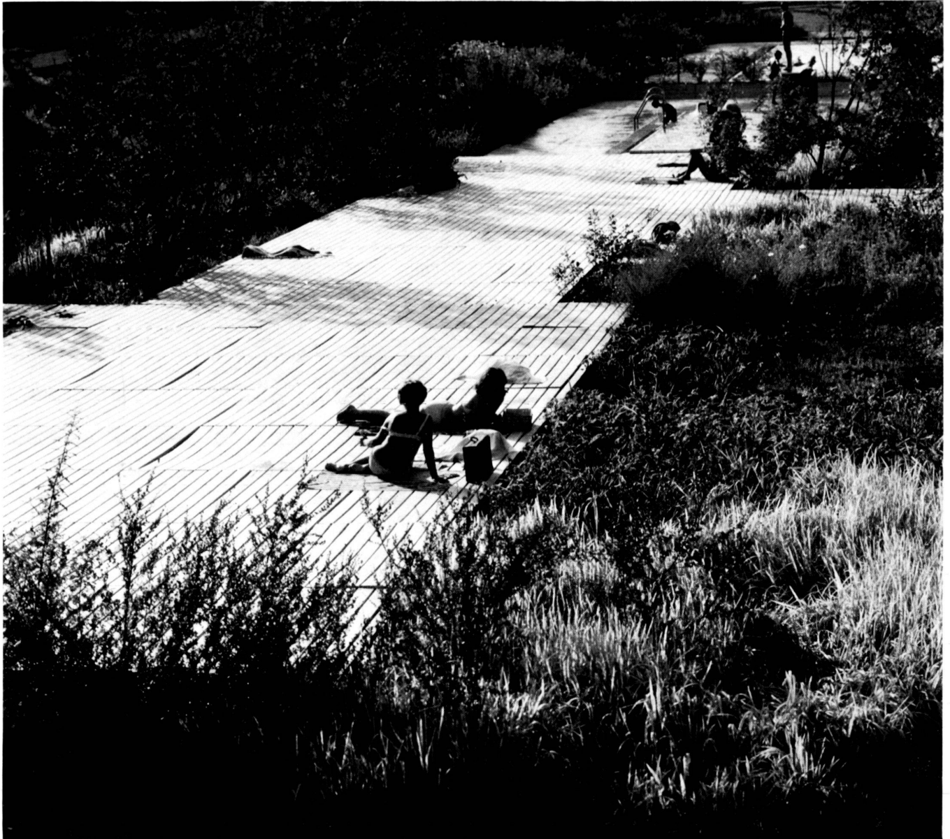
Sonnenbad mit Holzrosten aus Irokoholz

Architect: Building Department of the City of Zurich Director: A. Wasserfallen Collaborators: H. Kündig + R. Babini Garden Architect: Willi Neukom, Zurich