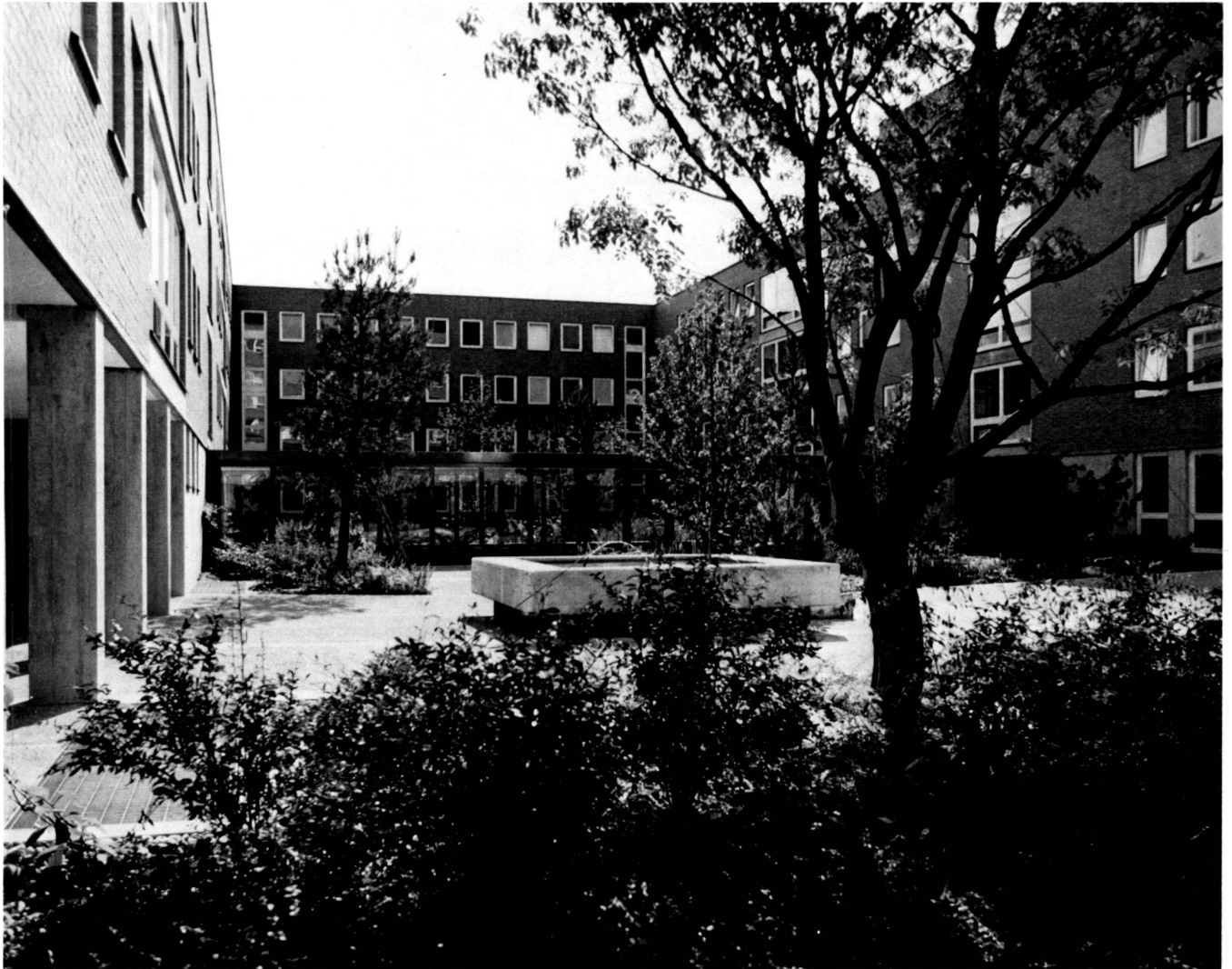
Zwei Innenhöfe mit verglastem Verbindungsgang. Immergrüne Pflanzen, Brunnen und grosse an Ort gegossene Waschbetonbeläge sind die Hauptakzente.

Located in the second basement is a fully equipped emergency hospital with various civil-defence structures. This involved the provision of a large basin holding water for fire fighting in the garden. The City of Win-