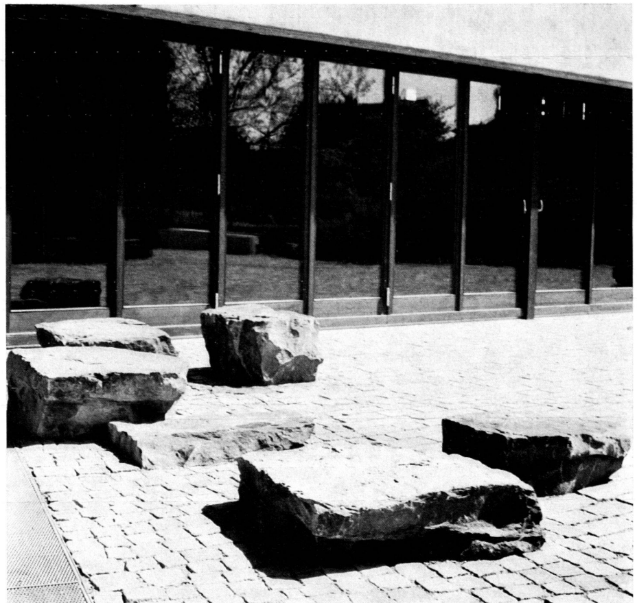
Anlage zum Kirchgemeindehaus in Thalwil/ZH. Spiel mit Steinblöcken vor den strengen Formen der Architektur. Gestaltung: E. Baumann, Gartenarchitekt BSG/SWB, Thalwil/ZH.