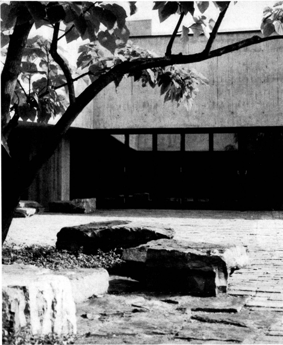
Anlage zum Kirchgemeindehaus in Thalwil/ZH. Dreiklang aus Architektur, wilden Steinblöcken und Vegetation. Gestaltung: E. Baumann, Gartenarchitekt BSG/SWB, Thalwil/ZH.