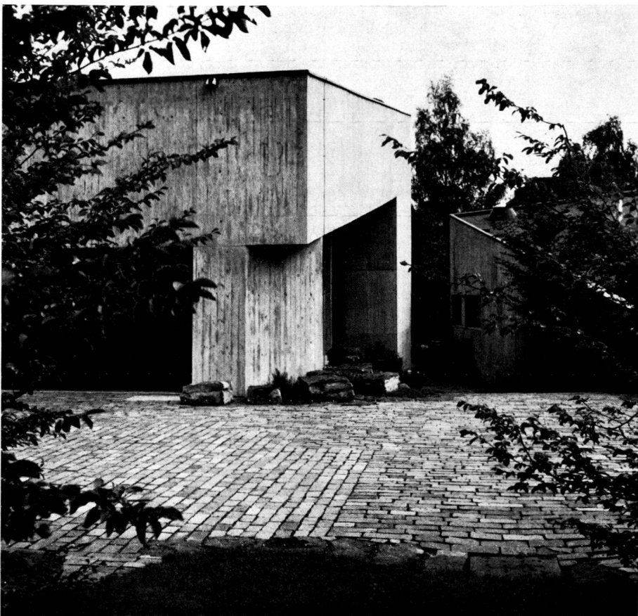
Park of the Thalwil/Zurich parish house. With a wide and subdivided paved area, the garden architect created a counterweight to the heavy architectural unit. Design: E. Baumann, garden architect BSG/SWB, Thalwil/Zurich.