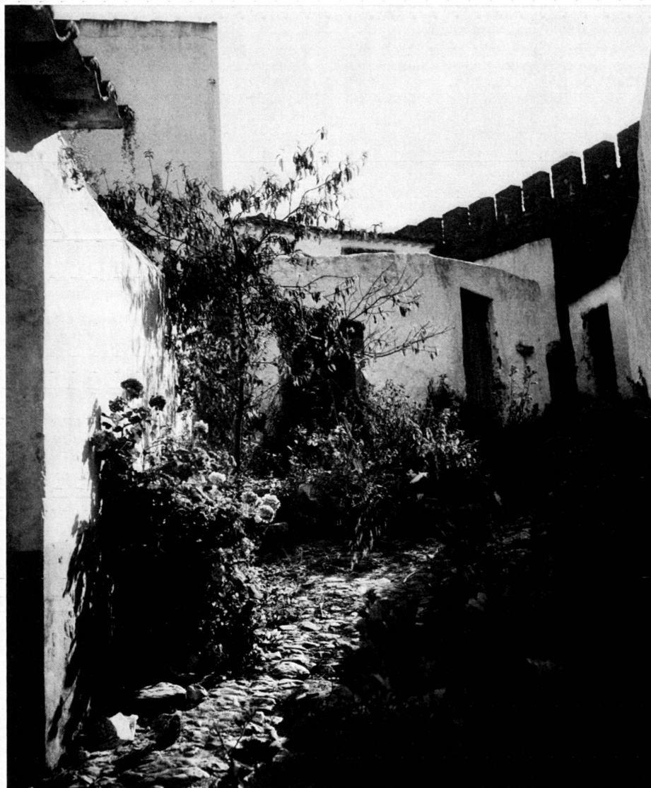
Malerischer Gartenwinkel in Obidos, eines in der Provinz Estremadura gelegenen Ortes stark mittelalterlicher Prägung über dem Tal des Rio Vargem.

Typical Portuguese landscape with large stands of evergreen oaks (background).