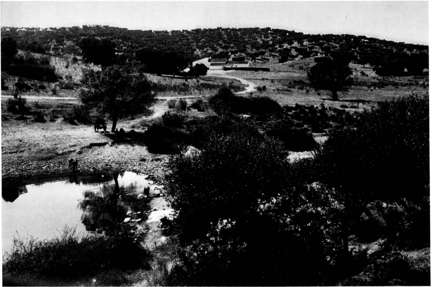
Typisch portugiesische Landschaft mit ausgedehnten Beständen von immergrünen Eichen (Hintergrund).

Campagne typiquement portugaise avec, à l'arrière-plan, de nombreux chênes toujours verts.