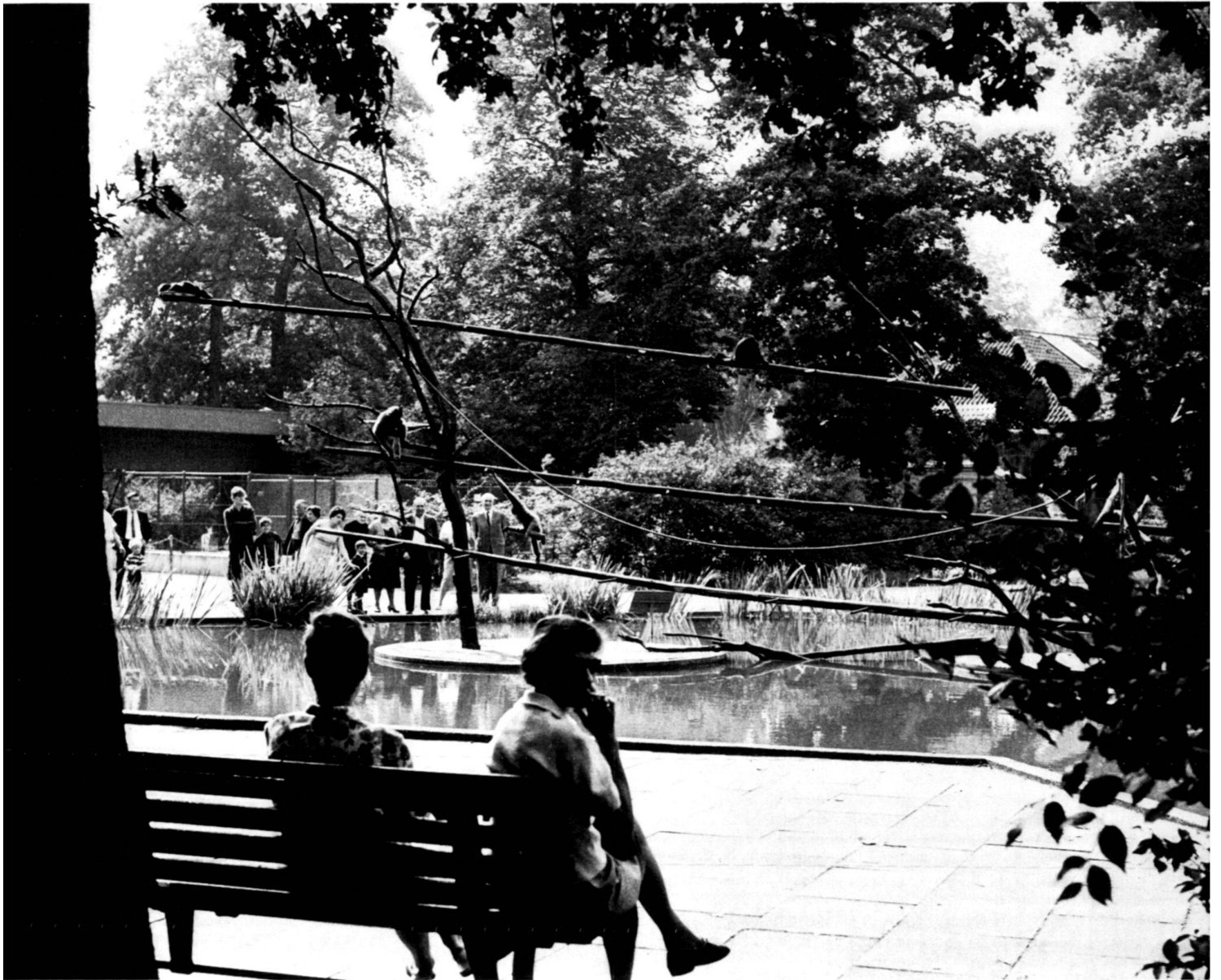
Gibbon-Anlage im Zoologischen Garten in Hannover.