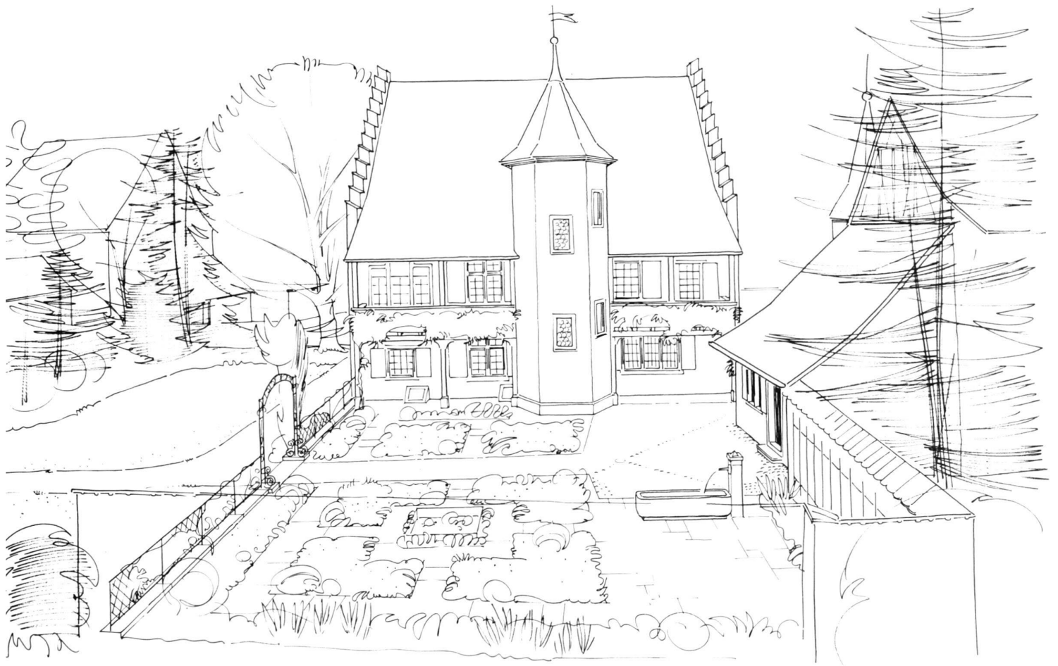
Ansichten des Architektur-Garten-Ensembles aus zwei verschiedenen Blickrichtungen. Zeichnungen des Gestalters.