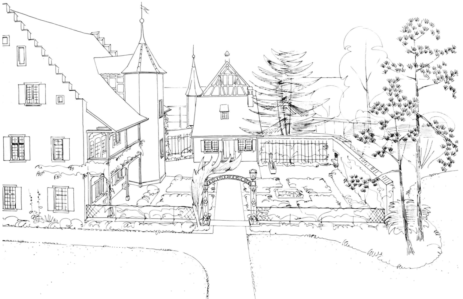
Views of the architecture/garden ensemble from two different sides. Drawings by the Designer.