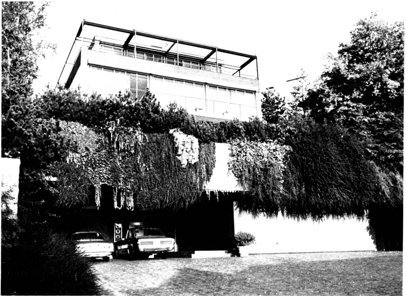
Strassenfront mit Autoeinstellraum und Vorplatz. Ein eindrückliches Beispiel, was mit sachkundiger Pflanzung am Bau erreicht werden kann.