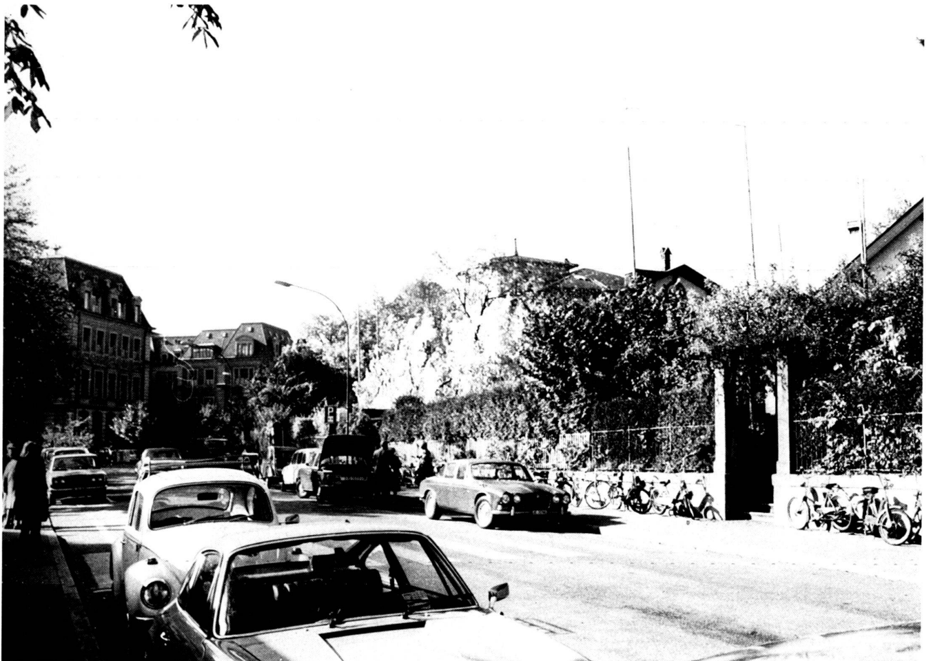
Before and after felling a tall tree. Impressive example of the effect of a tree in the urban scenery and streetscape.