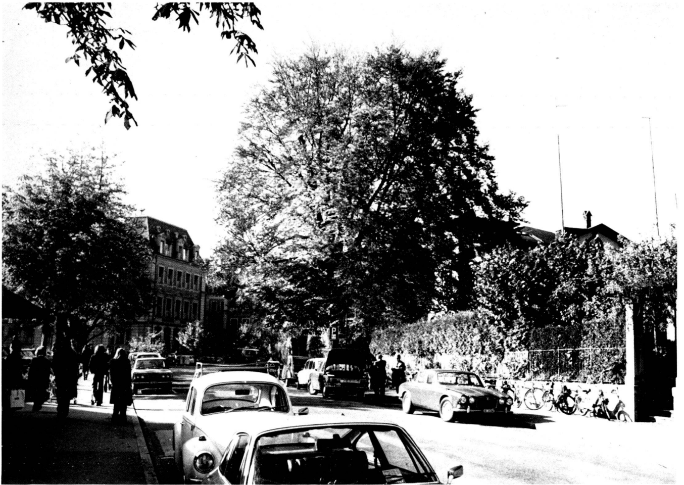
Vor und nach dem Fällen eines grossen Baumes. Eindrückliches Beispiel für die Wirkung eines Baumes im Stadt- und Strassenbild.