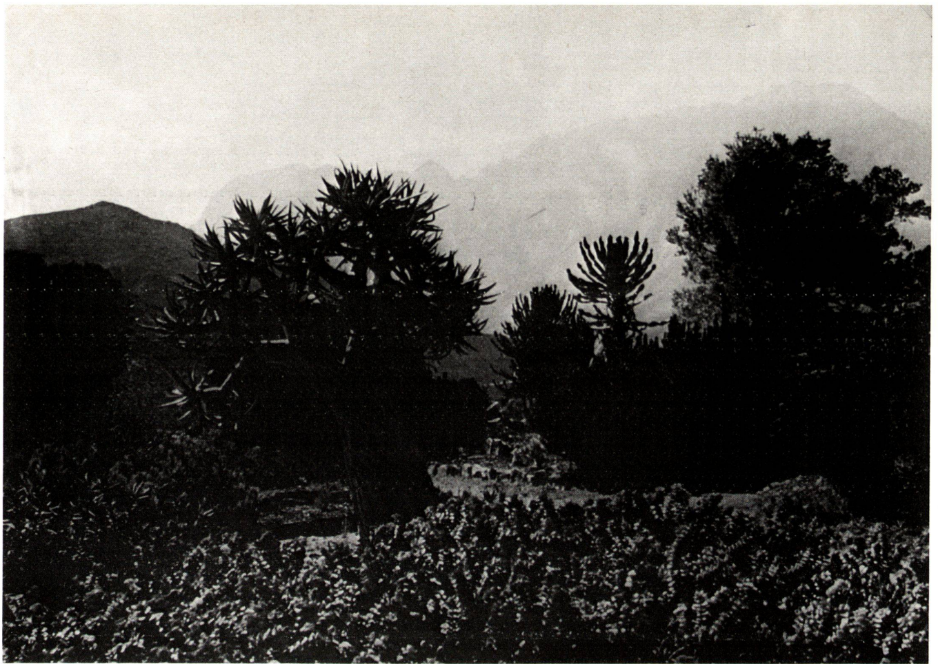
Die Flora der Kap-Provinz im Karoo-Succulent-Garden von Worcester in Südafrika.