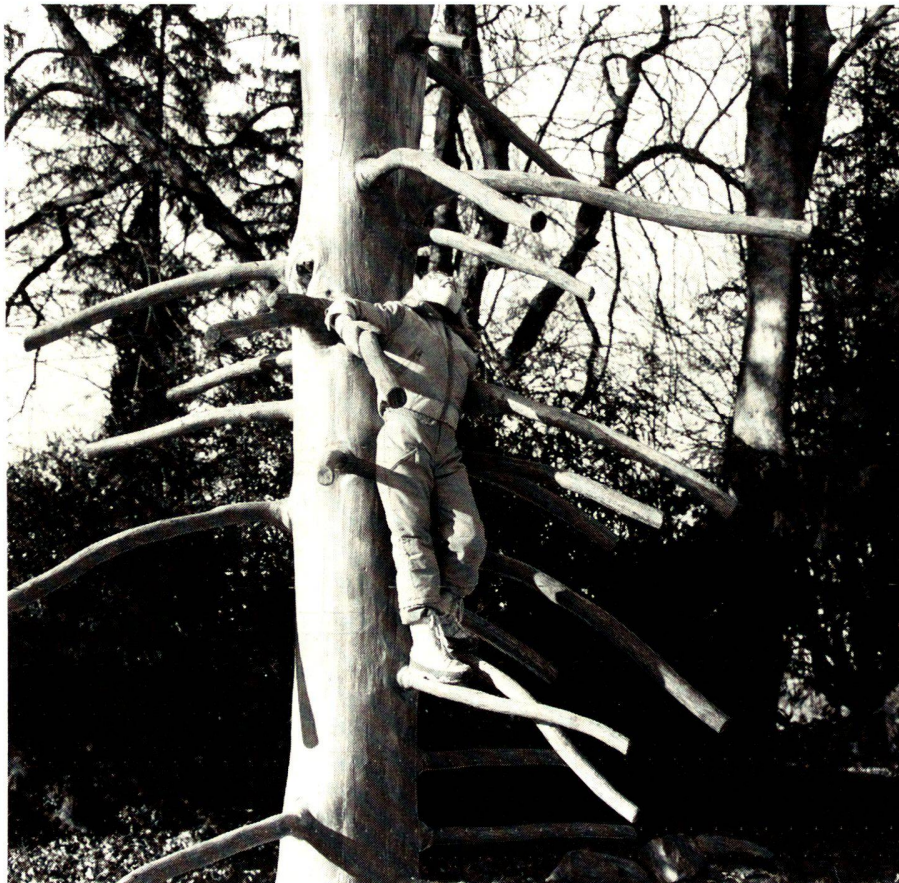
Kletterbaum in der Jugendspielanlage im Salinespark in Rheinfelden.

Solution: In order to avoid undesirable mutual interference to the extent possible, the various age groups should have allotted to them play areas with apparatus proper to their stage of mental and physical development. Young children should be given their area within view of the person who is in charge of them. Utilization of the topography as a separating factor is a suitable