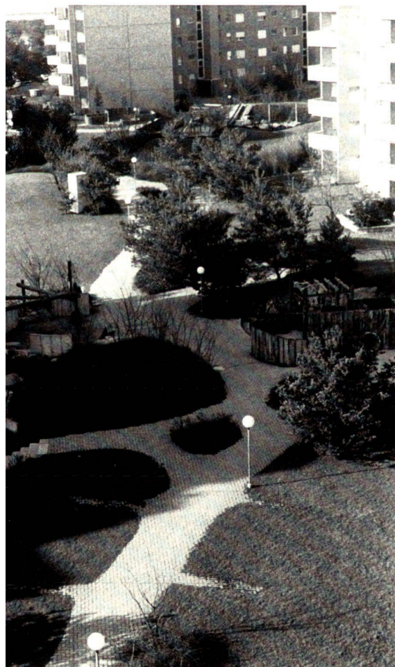
Oben: Ausschnitt aus der als Spielstrasse gestalteten Fussgängerachse der Siedlung «Ocht». Oben rechts: Holzgerätespielplatz. Im Hintergrund beschatteter Schachspielplatz. Rechts: Veränderbare Holzspielstruktur.

Seats and playgrounds are available for adolescents and adults, covered by tarpaulin or tree roofs against observation from the apartment windows. These yards offer space for games such as table-tennis, bowls and chess. In addition, there are clusters of seats with tables and benches. Great popularity is enjoyed by the hornbeam grove which is used for camping, sunbathing, barbecuing and the like.