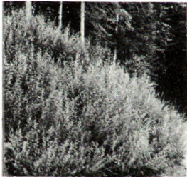
Hangrost nach 2 Jahren