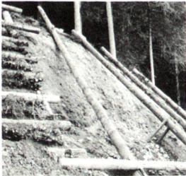
Hangrost im Bau