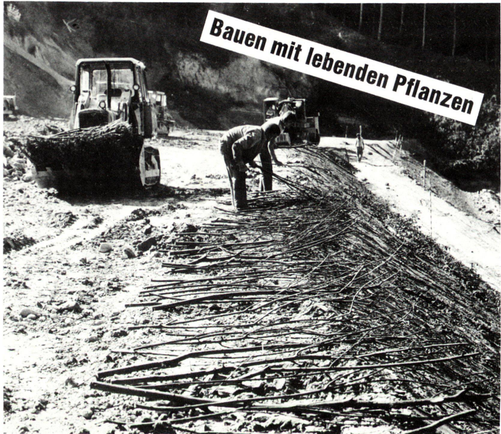
Autobahnböschung N6 bei Bern Stabilbauweise mit Buschlagenbau in Zusammenarbeit mit dem Kantonalen Autobahnamt Bern