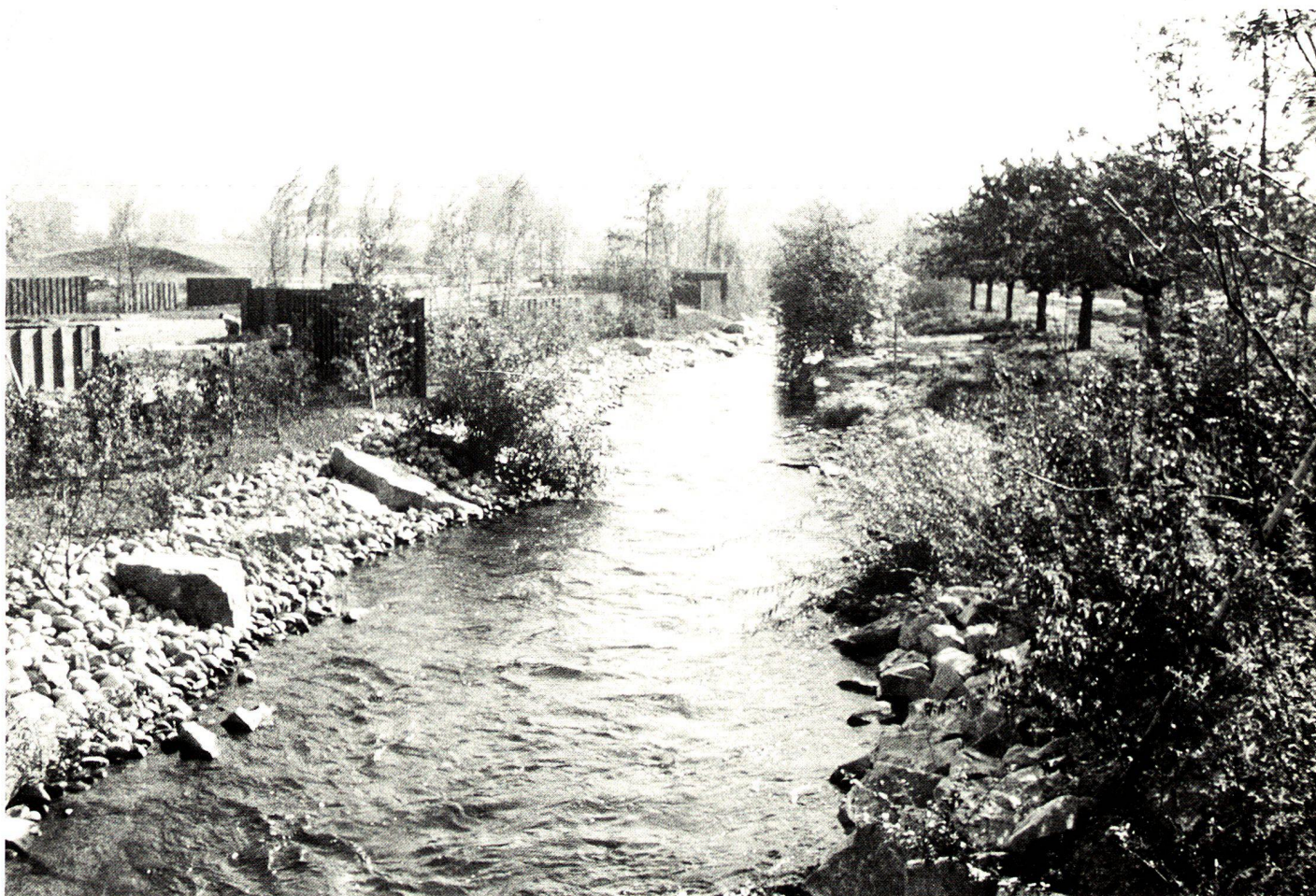
Ausbau des vormals gradlinigen Kanals zu einem naturnahen Gewässer.

The agencies responsible for the maintenance and operation of the body of water—the City of Basle civil engineering authority, the botanical garden of the City of