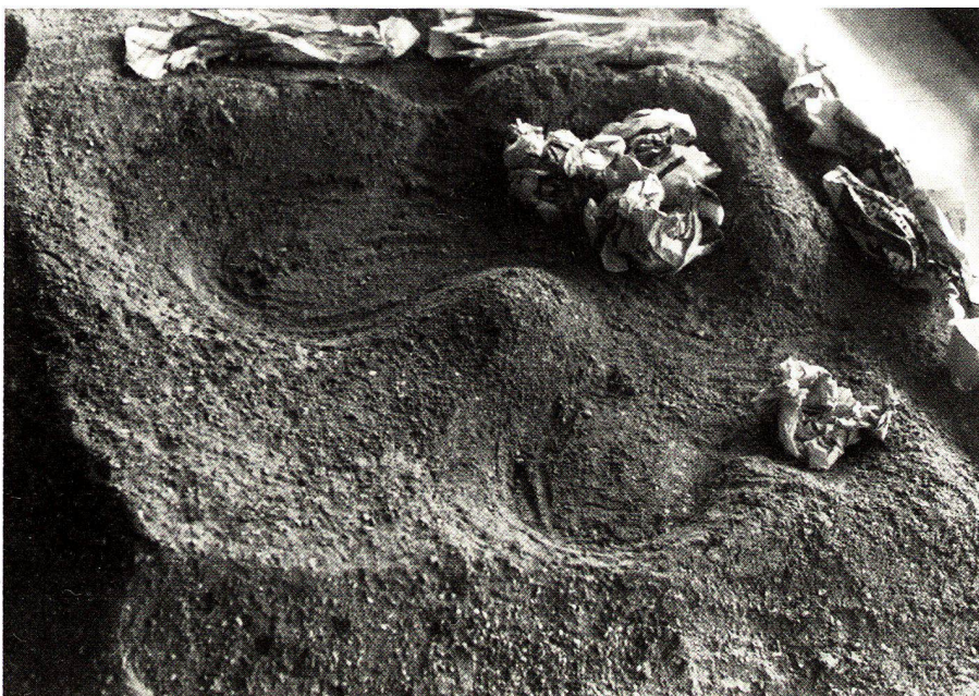
Übungsbeispiel zur Geländegestaltung (Sand). Gelände-modellierung für einen Spielplatz.

From the third and fourth semesters onwards, the emphasis is transferred to teaching the content and methodology of planning specific objects (garden architecture and landscaping) or of landscape