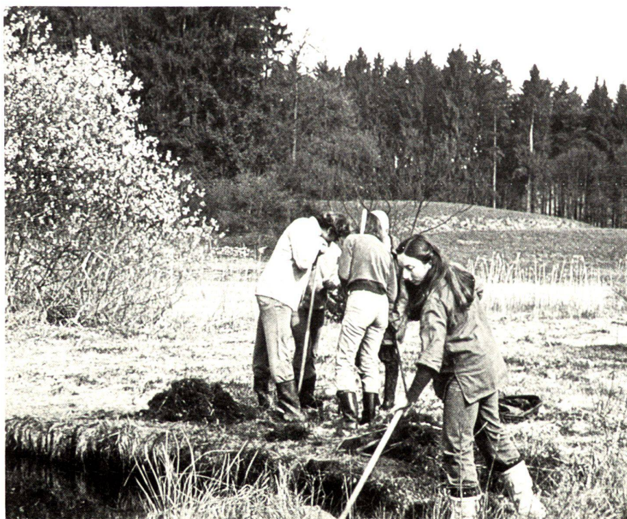
ITR-Studenten bei der Pflege eines Naturschutzgebietes.

Landscape planning Lenggis/Jona (Canton St. Gall). Emphasis: reduction of the building zones from the landscape plan-