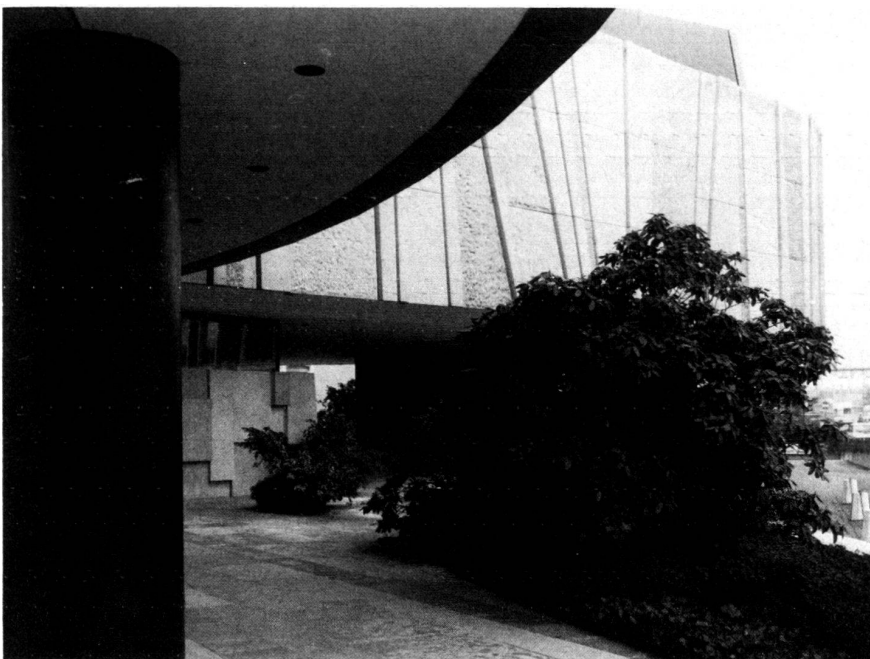
Immergrüne Pflanzungen im Eingangsbereich. Mächtige Rhododendron ergeben die zur Architektur erforderlichen Kontraste.