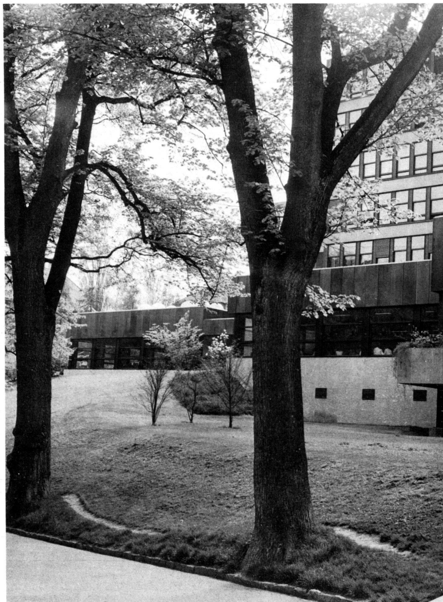
Blick durch den alten Baumbestand aus Linden am neuen Aargauer-Stalden zu den Dienstgebäuden.

The unusual given conditions in connection with this building also called for an appropriate execution technique and