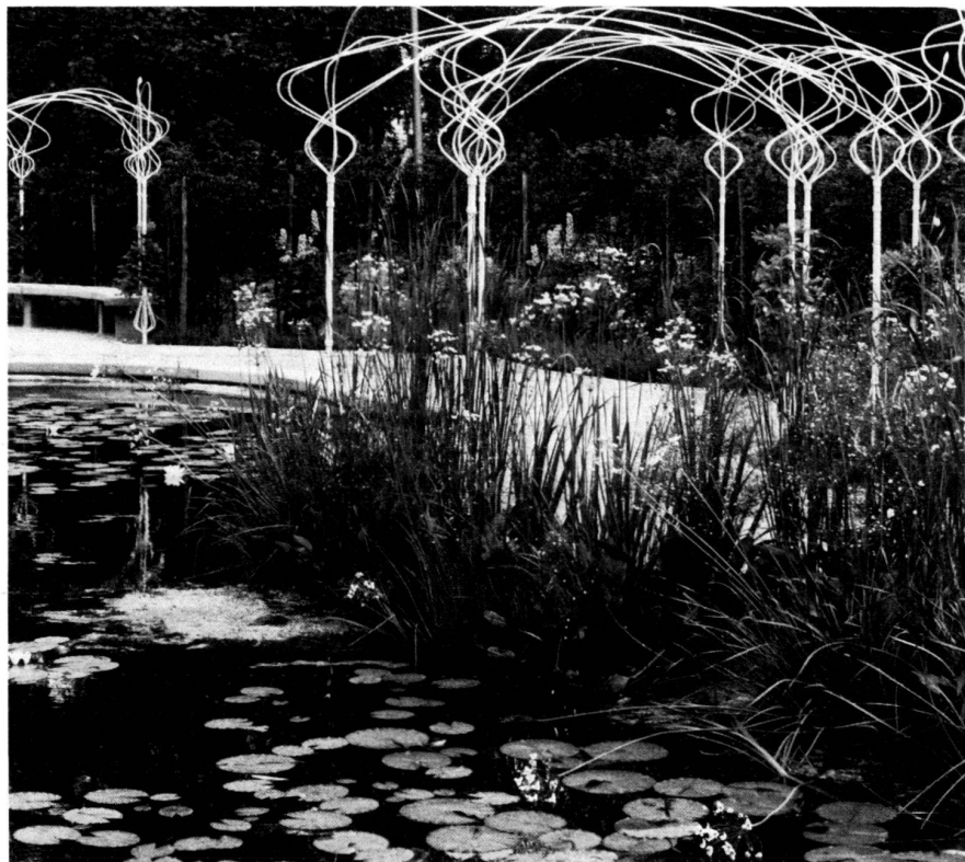
An der Bundesgartenschau 1981 in Kassel (30. April bis 18. Oktober) ist im Rahmen von 18 Einzelgärten (Themen- oder historische Gärten) auch ein Jugendstil-Garten zu sehen.