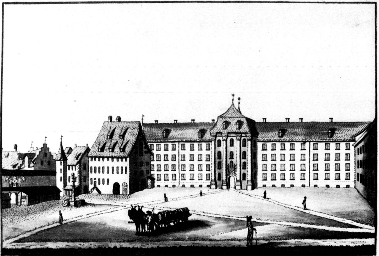
Das hochfürstliche Stift gegen der Pfalz in St. Gallen.

View of the New Palace prior to the construction of the Armoury Wing, from an engraving by J. C. Mayr, about 1790. The illustration shows an unadorned square with paths laid out purely for the greatest convenience; clearly for the most part the model for the present arrangement.