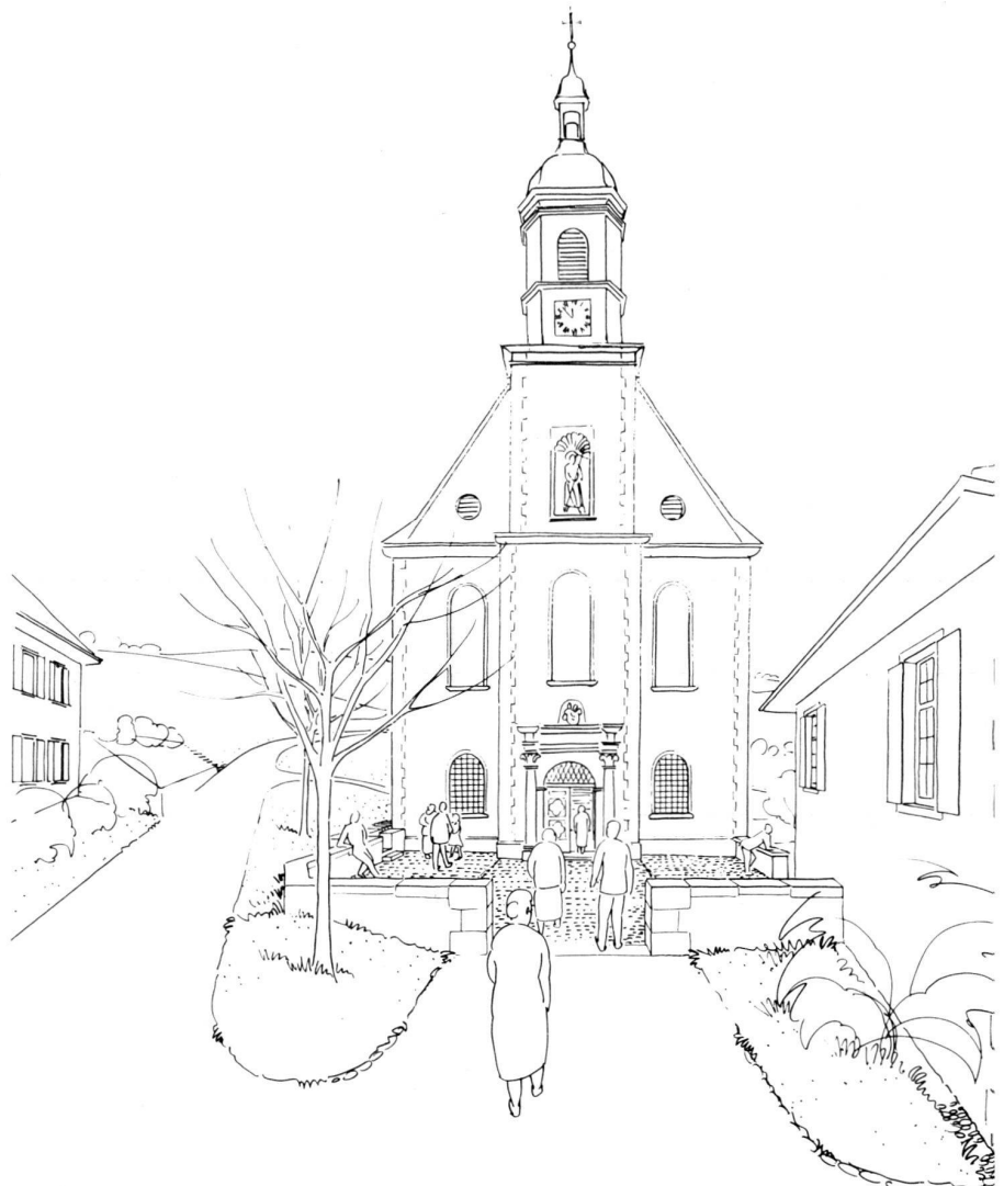
A gauche: Façade ouest de l'église collégiale d'Olsberg. Situation actuelle.