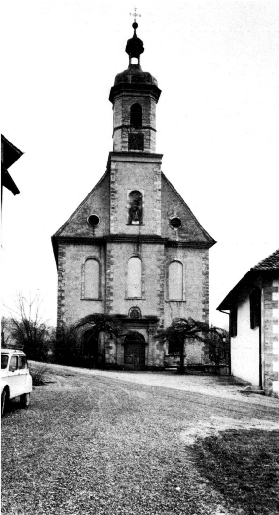
Links: Westfassade der Stiftskirche Olsberg. Heutige Situation.

giate church, an attempt is being made to improve the unsatisfactory situation in front of the church entrance also. As the road is indispensable, it is planned to erect a wall to retain the slope which extends up to the church door, so making it possible to lay out an even forecourt. To a large extent, the wall follows the ground plan of the demolished part of the Gothic church and re-establishes the original visual link between the church and the convent building. The result is a church forecourt which is separated from the traffic and whose self-contained character can be reinforced by two tall lime trees. To the west of the church, the road lies along the same axis as the church. Although this axial relationship is not absolutely necessary for a Gothic church, the late-baroque façade, which is the decisive element, can only be enhanced by the planned measure.