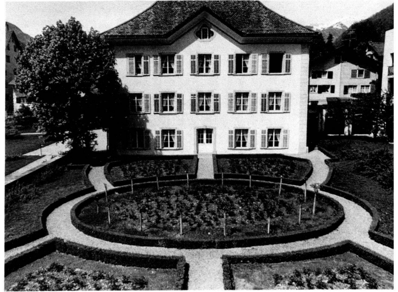
A gauche: Vue de la maison sur le jardin rococo aux formes simples et harmonieuses.

Rechts: Edel und einfach sind auch die Formen des herrschaftlichen Hauses, dem der Rokoko-Garten vorgelagert ist.