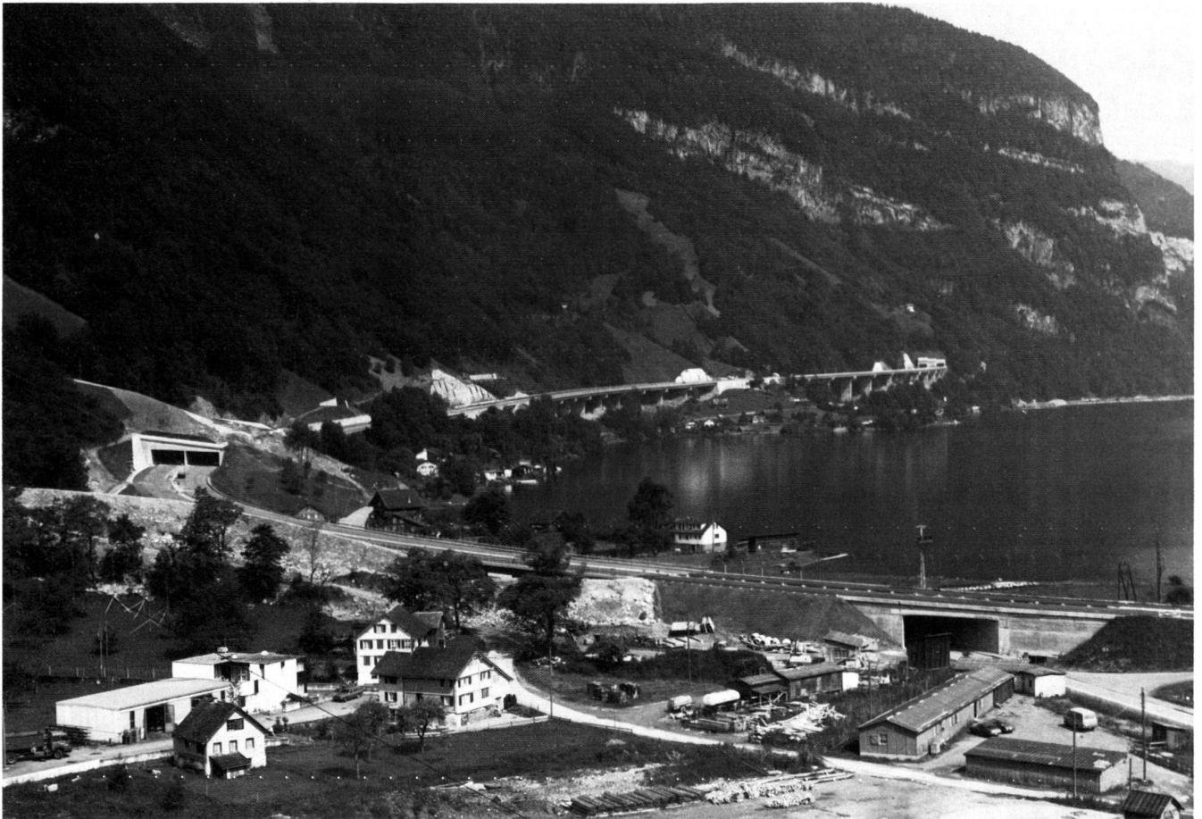
Die vom See zum Südportal des Seelisbergtunnels steigende Nationalstrasse ist in ihrer Lage bestimmt durch die Kreuzungen mit Lawinenzügen und Wildbächen und den steilen Felspartien. Die im Bild sichtbare Länge der Autobahn ist 2,1 km.