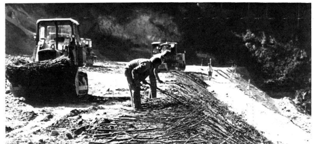
Bauen mit lebenden Pflanzen

Die INTERGREEN ® löst Begrünungsaufgaben in der Landschaft im Hydrosa-Verdyol-Verfahren