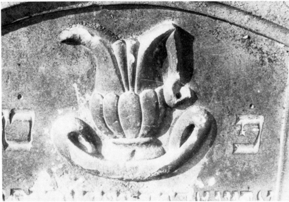
Die Kanne der Leviten (zur rituellen Handwaschung des Rabbiners vor dem Gebet, dargeboten vom Leviten). Symbol für einen Verstorbenen aus dem Stamme Levi.

La jarre des lévites (pour le lavage rituel des mains du rabbin avant la prière, offerte par le lévite). Symbole d'un défunt provenant de la tribu de Lévi.