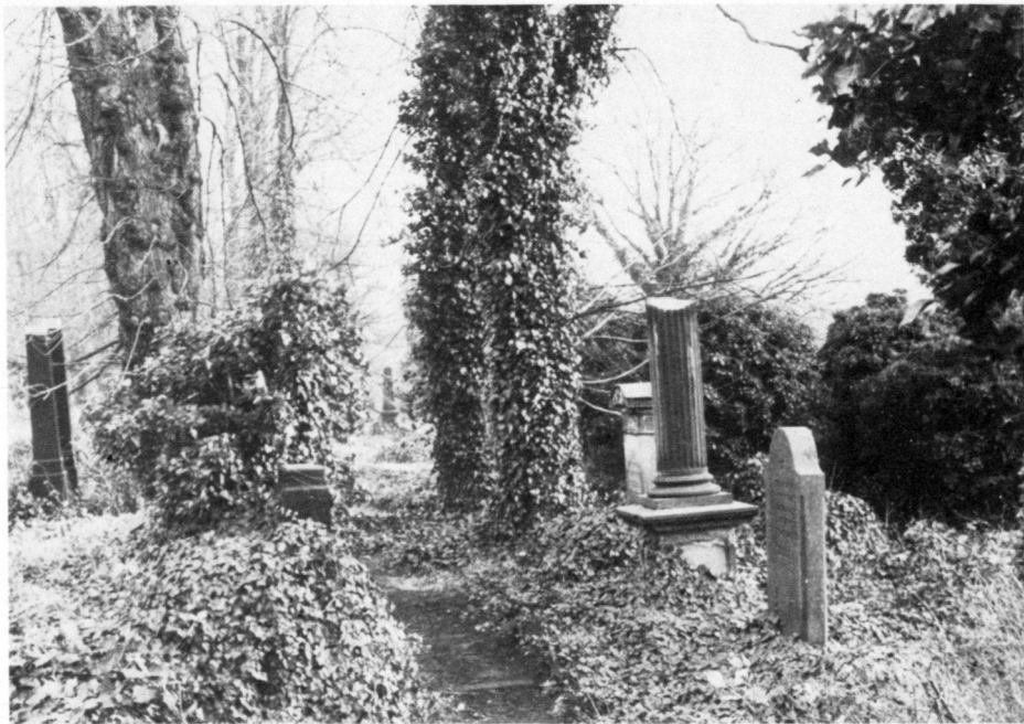
Links: Alter jüdischer Friedhof in Kassel. Hier zeichnen sich verschiedene Stilepochen in den Grabzeichen ab (klassizistische Grabsäule).