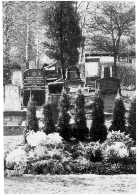
Left: Old Jewish cemetery in Kassel, showing various stylistic periods in its gravestones (neoclassical grave column).