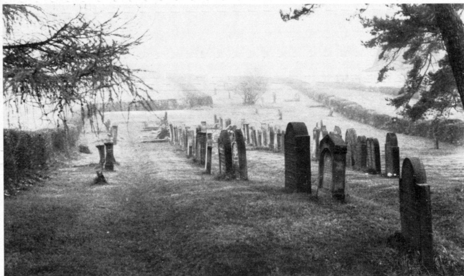
Meimbressen: In seiner Grundsubstanz liebevoll erhalten und gepflegter Judenfriedhof.

In accordance with its religious tenet that the dead are to be lodged unharmed, the Talmud, a binding collection of Jewish doctrine, promulgated that "their graves should be guaranteed to the dead forever". Another major difference between Christian and Jewish cemeteries is the location of the majority of very old Jewish cemeteries far outside built-up areas. Whereas the Christian church was generally centrally located, the Jews were compelled to bury their dead in collective cemeteries on the outskirts. It was not until the extensive secularization of the State and the age of Enlightenment that Jewish religious communities were allowed to establish their own burial grounds near their communities. With the coming of the industrial revolution and the extensive as-