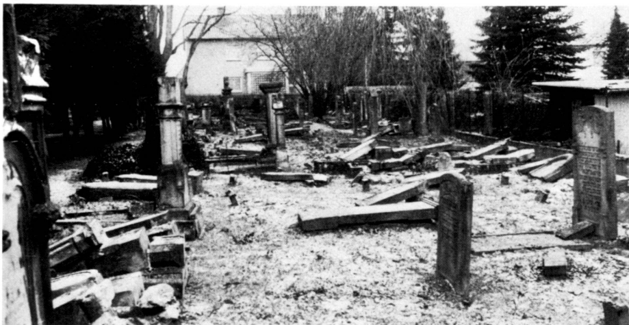
Eschwege: Trotz korrekter Vegetationspflege zeichnet sich hier der Zerfall des Friedhofes ab (Grabsteinumlegungen).

As early as 1957, the Federal Republic of Germany assumed responsibility for seeing to the upkeep of Jewish cemeteries. As burials and cemeteries are the concern of the local authorities and churches in West Germany, the local cemetery and horticultural authorities were instructed to carry out maintenance work on the cemeteries according to previously established guidelines. At present, the appropriate maintenance authorities receive an annual subsidy of DM 0.65 per square metre for looking after Jewish cemeteries. The laws on burials and cemeteries provide further administrative protection and state that the cemeteries of religious and ideological communities can only be used for other purposes with the consent of their sponsors, and this virtually signifies that Jewish cemeteries have a permanent right to exist. The registration of such cemeteries in the appropriate zone use and construction plans presupposes the