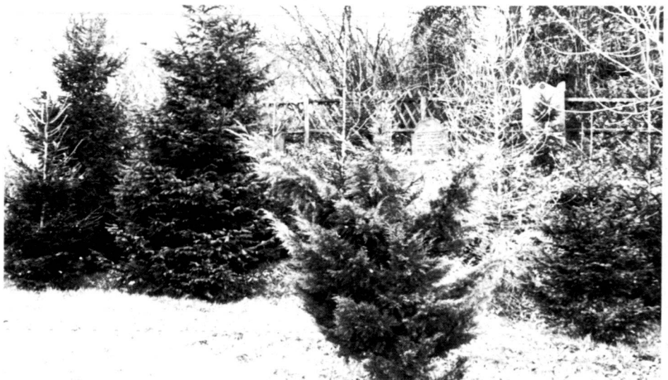
Hümme: Zerstörung eines Friedhofs durch gärtnerische «Aufforstung».