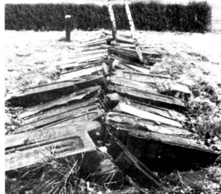
Breitenbach-Schauenburg: Dieses historische Ensemble ist zerstört durch das Abräumen und Zusammenlegen der Gedenksteine (rationelle Vegetationspflege!).

Du point de vue d'une réduction de frais à long terme et du désir de trouver des systèmes d'entretien respectant l'environnement, nous recommandons d'utiliser, dans les cimetières qui ne sont plus que rarement visités, des plantes de couverture du sol à entretien extensif qui ne devraient cependant pas recouvrir les pierres tombales. Il nous semble que le plus judicieux serait, écologiquement et esthétiquement parlé, non pas, comme c'est le cas dans certaines petites surfaces urbaines, de planter des déserts de cotoneaster, mais une couverture du sol qui avec un minimum d'intervention humaine se développerait quasi naturellement sous la voûte de verdure des arbres feuillus.