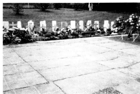
Rasenschutzmatten für den Friedhof.

Die Rasenschutzmatten, welche auch in der Grösse 33 x 33 cm erhältlich sind, können als