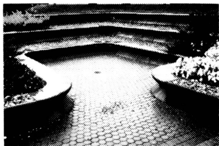
Anwendungsbeispiel für Papillon-Elemente.