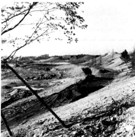
Links: Westpark Rohplanung im Oktober 1978, bereits weitestgehend fertiggestellt. Erste Grossbaumpflanzungen beginnen.

Im Sommer 1977 entschied mit mutiger Besonnenheit der damalige Stadtgartendirektor Josef Wurzer, es sollten beim Bau des Westparks, im Hinblick auf die Internationale Gartenbauausstellung, nur grosse Bäume im Alter zwischen 20 und 40 Jahren oder älter verwendet werden, mit Höhen von 8 bis 10 Meter, mit Kronen von 4 Meter Breite, mit Stammumfängen von 35 bis 40 cm. Der Entschluss war von der Absicht getragen, im Jahre 1983 einen fertigen Park zu präsentieren, der aus