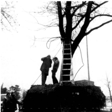
A gauche: L'érable est soulevé et chargé.