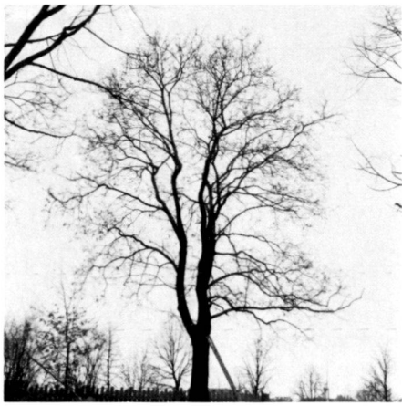
Links: 120-jähriger Ahorn für das IGA-Gelände an seinem alten Standort.