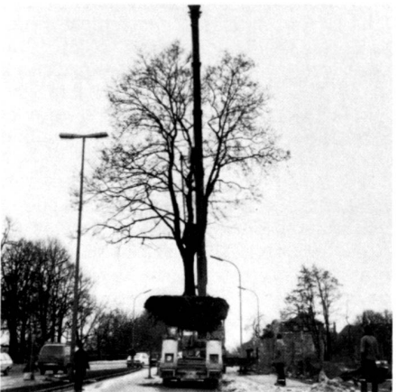
Links: Der Ahorn wird gehoben und verladen.