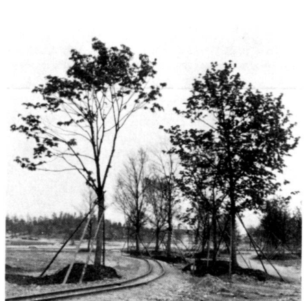
Left: Rough planning of the West Park in October 1978, with some areas completed. The first trees are being planted.

In summer 1977, Josef Wurzer, who was then director of the Municipal Gardens, took the carefully pondered and courageous decision, to use only fully-grown trees between 20 and 40 years old or older, with a height of 8 to 10 metres, crowns measuring 4 metres across and trunks 35 to 40 cm in circumference with a view to the International Horticultural Exhibition. The decision was motivated by the intention of presenting a ready-made park in 1983, "grown from scratch" out of a treeless plane. On the basis of previous experience, he could be sure that the experiment would succeed. Trees of that