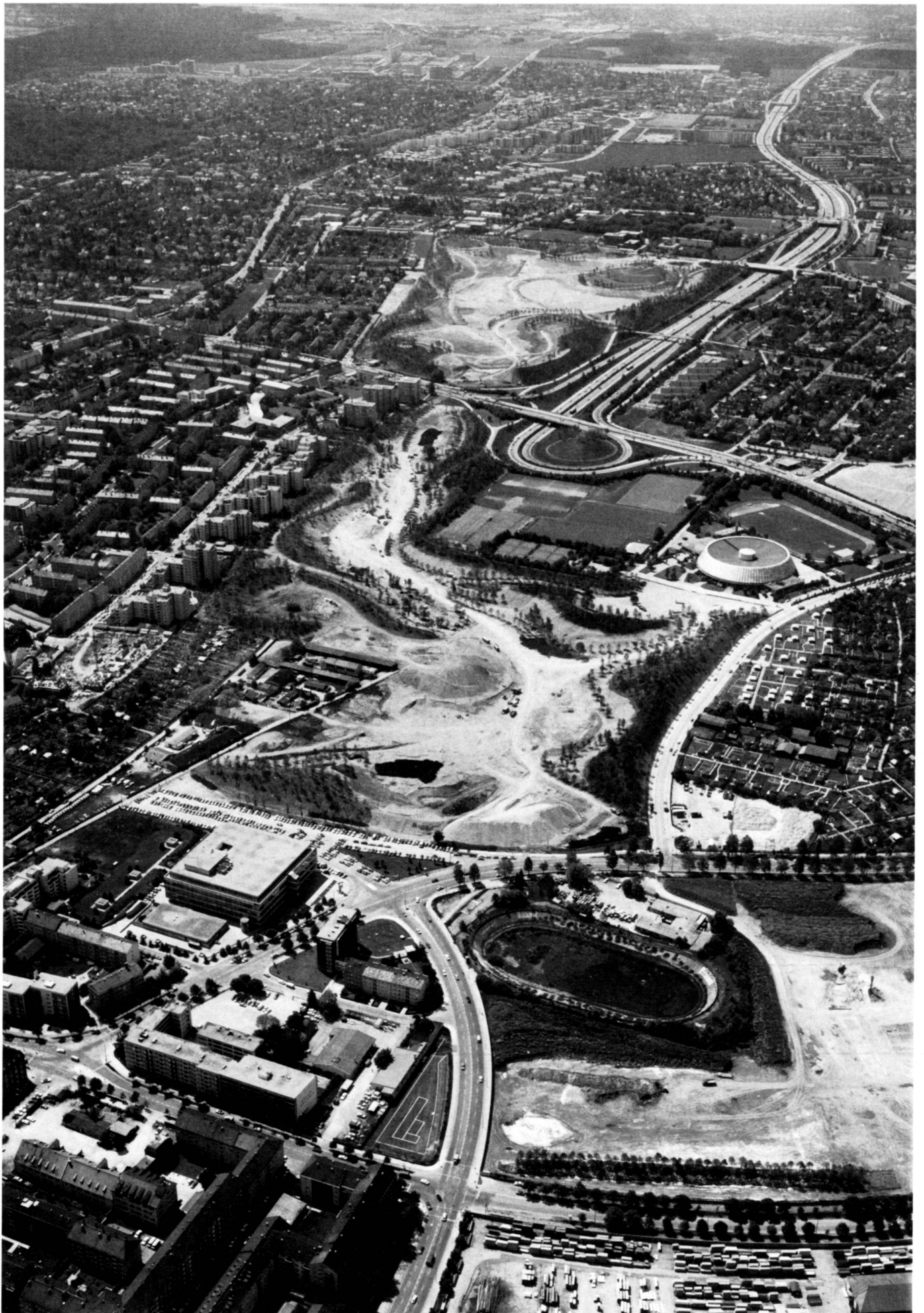
Das IGA-Gelände 1980 im Bau. Modellierung und Grossbaumbepflanzung sind weitgehend abgeschlossen.