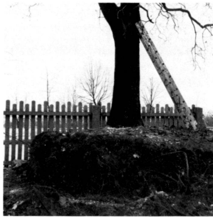
A gauche: Un érable de 120 ans pour le terrain de l'IGA à son ancien emplacement.