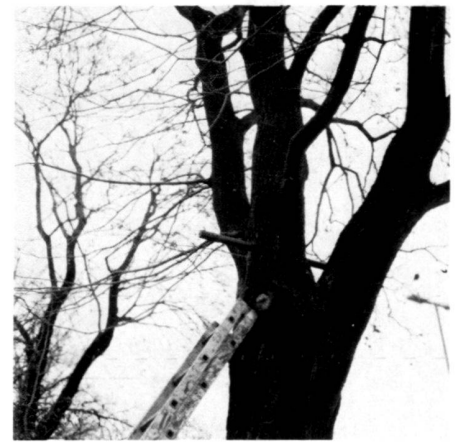
Left: 120-year-old maple tree for the IGA site on its former location.