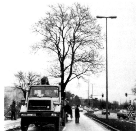
Left: The maple tree is raised and loaded.