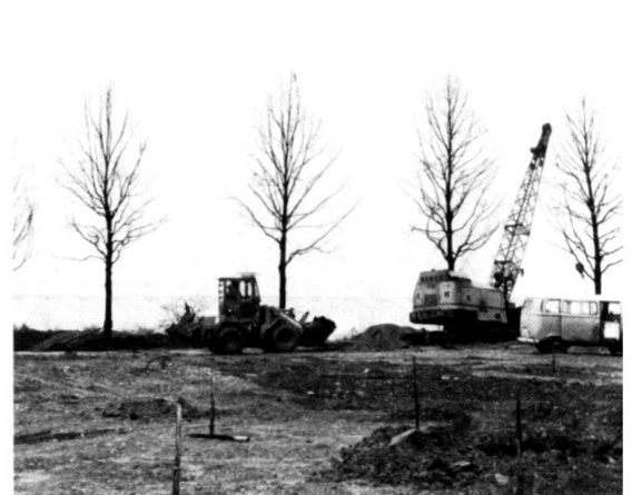
Westpark, März 1979. 60jährige Linden aus einem städtischen Friedhof werden angeliefert und gepflanzt.