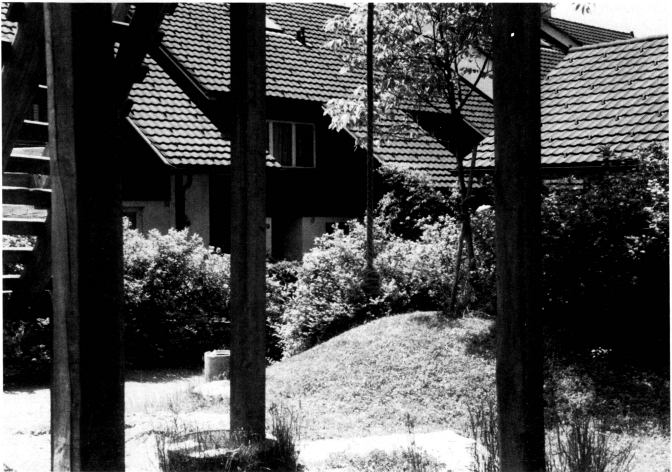
Spielplatz mit Blick auf die Häuser.