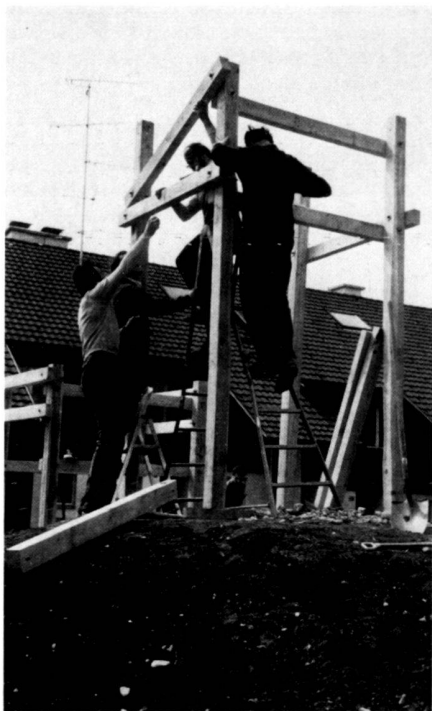
Gemeinsame Montage des Klettergerüsts.

A gravel path leads to the playground which is too small in size to create a proper playfield. The terrain is shaped so as to create a landscape suitable for playing with no prying views. In winter, it's a sledging ground. The rear of the hill is planted with native bushes, and the area near the house entrances with flowering shrubs. A nut tree provides shade. On the eastern edge of the estate there are fruit trees and various berry bushes. The sandpit is separated from the gravel square by the existing sandstone blocks. The simple climbing frame with two platforms and a tower was built by the residents themselves. The erection of this strong, versatile frame was the occasion of the first joint party. The playground is part of the development; it can at any time be adapted to current requirements. Contact among