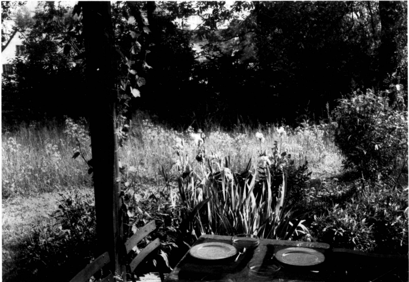
House garden seen from the seat.