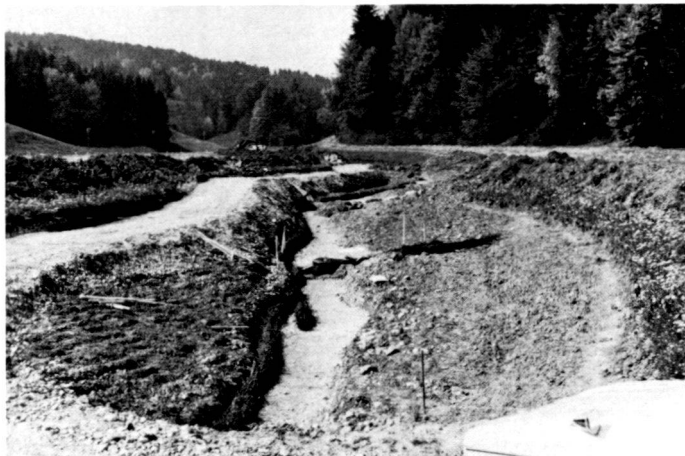
A gauche: Au printemps 1980, lors de la construction de la traverse et du montage des fascines.