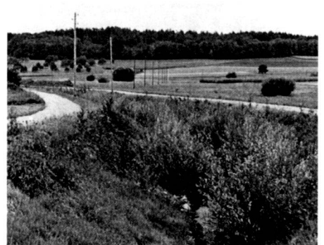
The pictures show the course of the brook to the west of the Wilenhof bridge with varying widths of channel and differing embankment gradients. Picture 1 was taken in March, picture 2 in June and picture 3 in August 1982. The sequence shows how quickly the willow bundles sprouted and grew and how the greenery was quick to spread on the embankments (no humus used) thanks to use of the appropriate seed mixture.