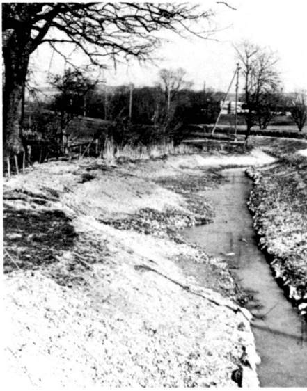
Der Bachlauf östlich der Brücke Wilenhof zeigt, dass beim Bau der vorhandene Baum- und Buschbestand nach Möglichkeit erhalten blieb und wie auf der linken Seite dank sehr flacher Böschung die Schilffreste sich wieder ausbreiten können. Bild 1 wurde im März, Bild 2 im Juni, Bild 3 im August 1982 aufgenommen.