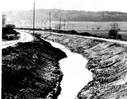
Les images présentent le cours du ruisseau à l'ouest du pont de Wilenhof, avec une largeur variable du radier et des pentes de talus inégales. La fig. 1 a été faite en mars, la 2 en juin et la 3 en août 1982. La séquence montre avec quelle rapidité les fascines d'osier ont cru et se sont développées et combien le vert est rapidement apparu sur les talus sans humus, grâce au mélange de semences approprié.