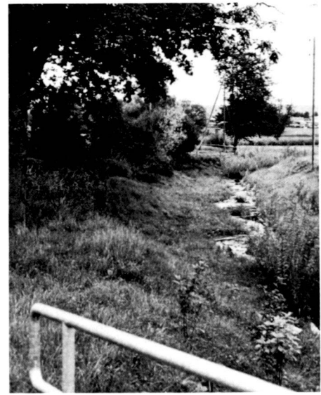
The course of the stream to the east of the Wilenhof bridge shows that, where possible, the existing stocks of trees and bushes were retained during construction and how, on the left-hand side, the surviving reeds are able to spread once more on the extremely flat embankment. Picture 1 was taken in March, picture 2 in June and picture 3 in August 1982.

Pflanzung ausgiebig gewässert und eine Bewässerung bis in den Sommer organisiert. Dank diesen Massnahmen konnte ein gutes Anwachsen mit wenig Ausfall erreicht werden.