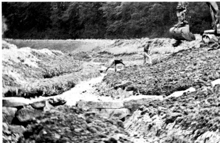
Links: Im Frühling 1980 beim Bau der Querriegel und dem Faschineneinbau.

The "natural" correction of the Mülibach is an attempt to tread new ground in stream correction. The aim was to rebuild a stream in such a way that, in time, it can develop