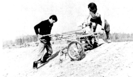
Für jeden einzelnen Baum und Strauch wurde mit dem benzingetriebenen Bohrer ein Loch in die nicht humusierte Böschung gegraben.

Bundesamt für Wasserwirtschaft (Hrsg.): Hochwasserschutz an Fliessgewässern. Wegleitung 1982. EDMZ. Ch. Göldi und F. Bieler, 1982: Jutegewebe zum Schutz von frisch humusierten Böschungen im Wasserbau. «Schweizer Ingenieur und Architekt», Heft 32/1982. R. Maurer, 1976: Landschaftsökologische Zusammenhänge. «Schweizerische Bauzeitung», Heft 23/1976. H. Vögeli, 1980: Zum Schutz der Naturbäche im Kanton Zürich und Gedanken für naturgemässe Bachkorrekturen. «Natur und Mensch», Heft 6/1980.