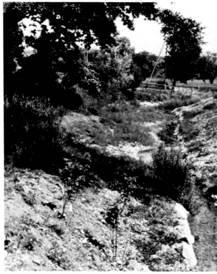
Le cours du ruisseau à l'est du pont de Wilenhof montre que lors de la construction, les arbres et buissons existants ont été conservés autant que possible et comment les roseaux peuvent de nouveau s'étendre sur la rive gauche, grâce au talus très plat. La fig. 1 a été faite en mars, la 2 en juin et la 3 en août 1982.