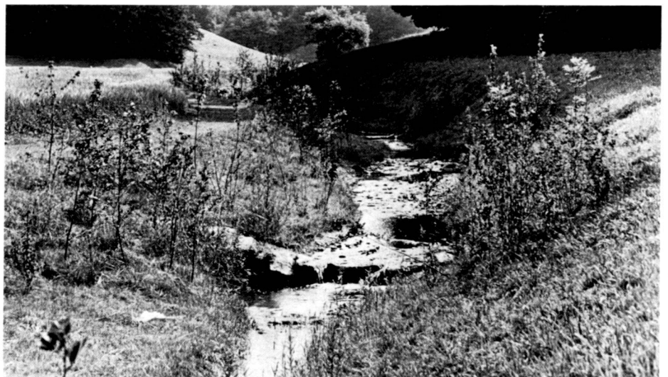
Der Mülibach im Juli 1981, ein Jahr nach der Fertigstellung.

Commissioning authority: Community of Bauma Project and construction supervision: E. Diebold, engineering office Ltd., Russikon