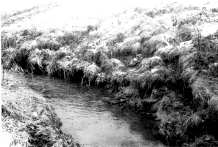
Links: Typische Schadstelle. Unterspülte und abgerutschte Wiesenböschungen.

The course of the stream below the pond runs partly through forest and partly through open meadows. In the open section, very pronounced meanders have formed in some places with the typical underwashing of the meadow embankments on the external curve. However,