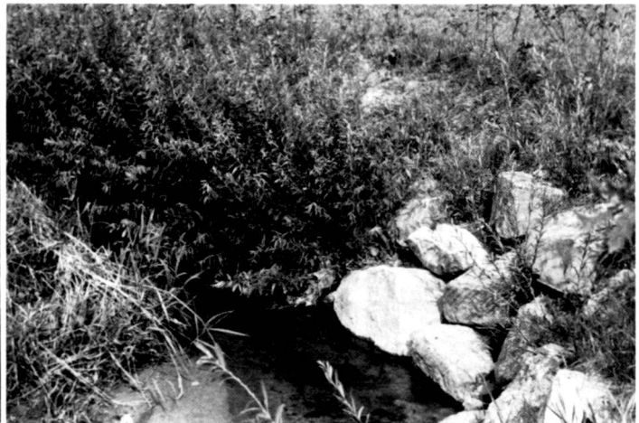
A gauche: Endroit défectueux typique. Talus de prés érodés et affaïsés.

A droite: Même endroit défectueux après assainissement. Blocs avec buissons d'osier dans la courbe étroite; fascines dans la zone de transition.