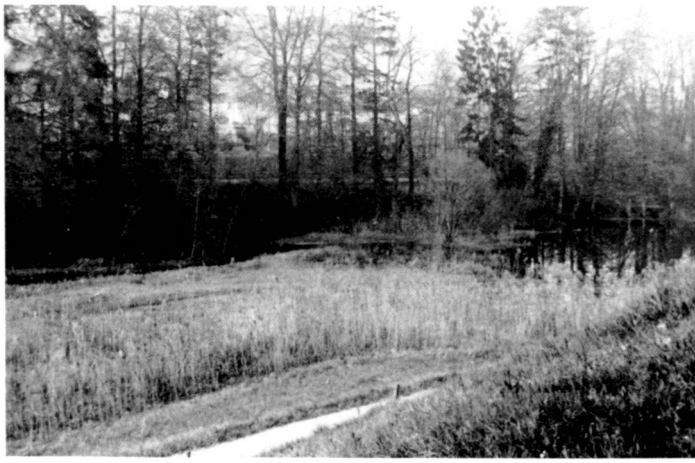
Links: Weiher vor der Ausbaggerung. Die verlandeten Flächen sind gut sichtbar.