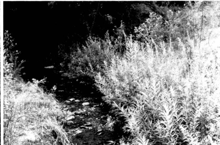
Left: Typical damage situation. Underscoured meadow bank which has collapsed.

A gauche: Fascines, avant le débourement des osiers. A droite: Fascines, après le débourement des osiers.