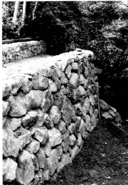
Links: Wasserfall vor der Sanierung, einseitiges Sohlgefälle ersichtlich.