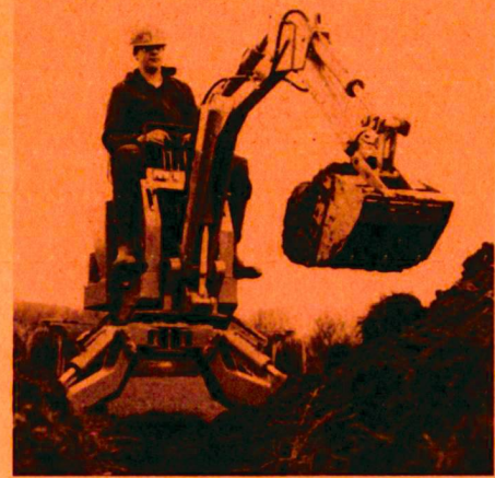
Powerfab 360, die motorisierte Schaufel und Spitzhacke.

Im Sektor 11 findet der Landschaftsgärtner schwerpunktmässig Natur- und Kunststeine, Betonelemente und Spielgeräte. Das Angebot ist ebenso umfassend wie bei den Rasenpflegemaschinen im Sektor 3. Kleine, für den Fachmann entscheidende Detailverbesserungen prägen die gezeigten Produkte vieler Aussteller.