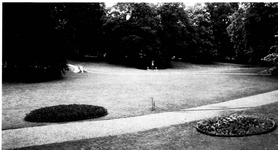
Glienicke-Park, Berlin; Blick über den wiederhergestellten Pleasureground mit restaurierten Beeten, 1984.

Before work is started on an object, an exact record of the structure is generally made in addition to a thorough study of the sources. In addition to an exact topographical survey of the green parts of the grounds, an object record of this kind also includes detailed measuring out not just of the existing garden and park structures, pathways, open spaces, areas of water, etc., but also a mapping out of all trees and bushes. Taken in addition to the usual primary and secondary sources, a survey like this provides the definitive basis for all measures to be undertaken in future. Such a procedure is an absolute must for any scientifically based care of garden monuments, as the objective is not only to clearly record the exact locations, thickness, age and mixture of species of the existing old trees and bushes (which are often in a ruin-