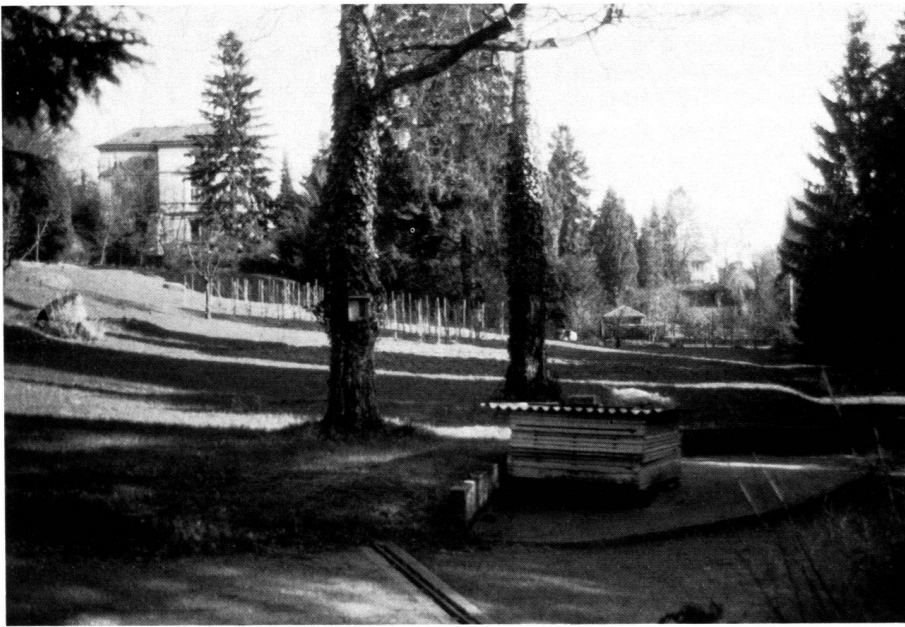
Der Landschaftsgarten wird zurzeit vom botanischen Garten bewirtschaftet.