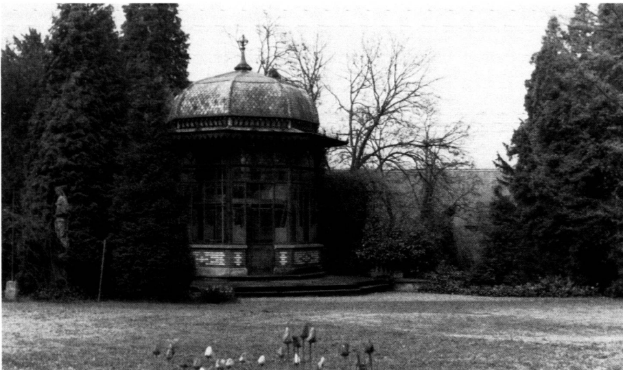
Der Pavillon im bereits geschützten Parkteil.